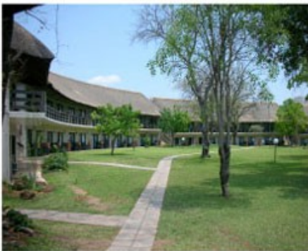
A'Zambezi River Lodge

Die Viktoriafälle im Norden an der Grenze zu Zambia sind mit Sicherheit das Highlight des Landes, wenn nicht sogar des ganzen afrikanischen Kontinents. Auf über einem Kilometer Länge stürzt der mächtige Zambezi River abrupt über 100m in die Tiefe in eine nur noch 50m breite Schlucht. Ein Naturwunder, welches seines Gleichen sucht. In der Regenzeit zwischen November und April fließen hier rund zehn Millionen Liter Wasser pro Sekunde über den Felsrand. Der entstehende Sprühnebel der Wasserfälle kann bis zu 400 Meter in die Höhe steigen und erzeugt in unmittelbarer Nähe einen üppigen Urwald, verdeckt aber auch ein wenig die Sicht. In der Trockenzeit fließt deutlich weniger Wasser, dafür fehlt aber auch meist der störende Nebel. Der touristische Ort Victoria Falls bietet darüber hinaus eine Vielzahl von Aktivitäten wie Sunset Cruises auf dem oberen Teil des Zambezi River, Kanufahrten, Wild Water Rafting, Bungee Jumping, Rundflüge über die Wasserfälle, Elephant Back Safaris und vieles mehr.