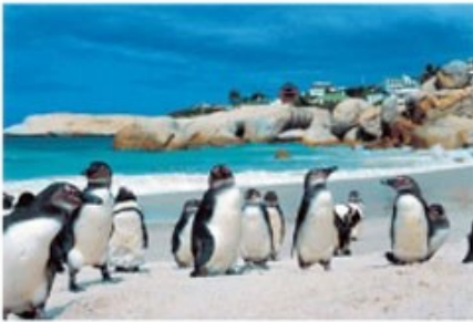
Pinguine am Boulders Beach