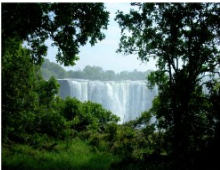
Blick durch den Regenwald