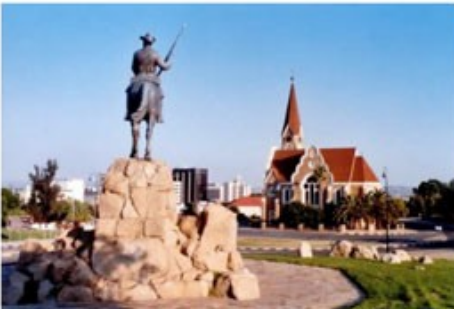
Reiter und Christuskirche in Windhoek

1x Übernachtung mit Frühstück Olive Grove Guesthouse (Standard Room)