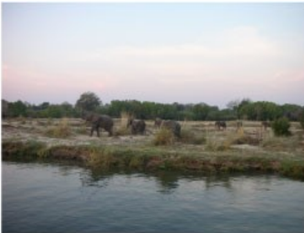
Elefanten am Ufer

Sie werden an Ihrer Unterkunft abgeholt. Dauer der Cruise ist etwa zwei Stunden. Die Toursprache ist englisch.