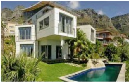
Exklusiv für SA Travel Kunden: Lobster House

4x Übernachtung mit Frühstück Lobster House (Luxury Room)