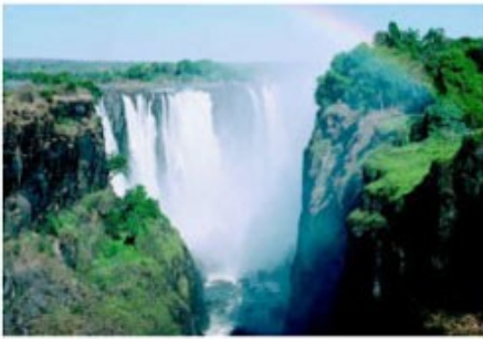
Die mächtigen Viktoriafälle

2x Übernachtung mit Frühstück A'Zambezi River Lodge (Standard Room )