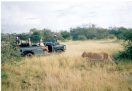
Pirschfahrt im offenen Geländewagen

3x Übernachtung mit Vollpension und 5 Aktivitäten Shiduli Safari Lodge (Three Nights Package incl. Transfer)