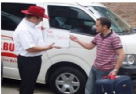
Transfer mit Meet & Greet

Bei einem Shuttle Transfer begeben Sie sich bitte zum im Voucher genannten Treffpunkt.