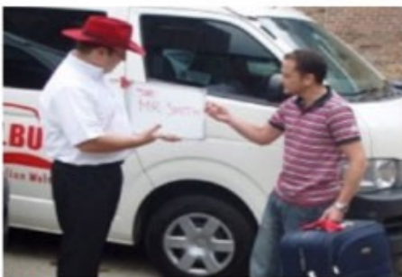
Transfer mit Meet & Greet

Bei einem Shuttle Transfer begeben Sie sich bitte zum im Voucher genannten Treffpunkt.