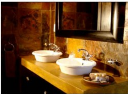
Zimmerbeispiel der Shiduli Safari Lodge

Im Karongwe Game Reserve liegt die luxuriöse und gerade renovierte Shiduli Safari Lodge. Bei vier geführten Pirschfahrten im offenen Geländewagen in privaten Reservat sowie einem Ganztagesausflug in den Krüger Park entdecken Sie die Big Five und alle weiteren afrikanischen Wildtiere. (24 Zimmer: Bad/WC, Moskitonetze, Klimaanlage, Veranda, Telefon. Lodge: Pool, sicheres Parken, Boma = traditioneller Essensplatz, Tierbeobachtungsmöglichkeiten)