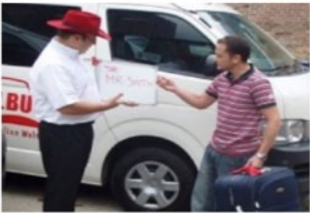
Transfer mit Meet & Greet

Bei einem Shuttle Transfer begeben Sie sich bitte zum im Voucher genannten Treffpunkt.