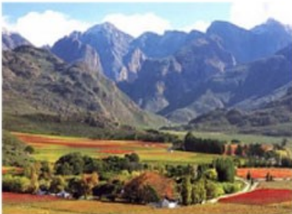
Weingebiete im Western Cape