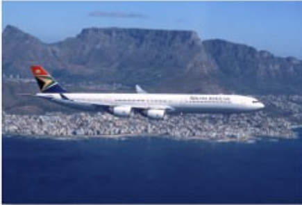
Flug mit der SAA