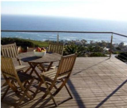
Exklusiv für SA Travel Kunden: Lobster House

Willkommen in der Mother City. Ihr erster Ausflug sollte auf den Tafelberg gehen, damit Sie sich erstmal einen Überblick verschaffen können. Ein Muss ist auch die Fahrt über den Chapmans Peak Drive, einer beeindruckenden Küstenstraße, die vorbei an der Pinguin-Kolonie von Boulders Beach bis zum Kap der guten Hoffnung führt. Kapstadt ist aber auch ein Shopping-Paradies. Die V&A-Waterfront lädt ein mit unzähligen Geschäften und Restaurants. Hier starten auch die Fähren zur ehemaligen Gefängnisinsel Robben Island. Im Gegensatz zu anderen Großstädten Südafrikas ist die Innenstadt von Kapstadt relativ sicher, sodass Sie einen Bummel vom Museumsbezirk zum bunten Bo-Kaap-Viertel nicht auslassen sollten.