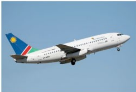
Flug mit der Air Namibia

Die Air Namibia ist die staatliche Fluggesellschaft des Landes und betreibt neben den inländischen Verbindungen auch Flüge ins benachbarte Ausland wie etwa nach Kapstadt, Johannesburg und Victoria Falls.