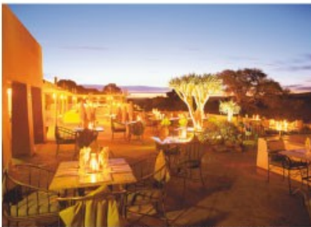
Abendstimmung in der Sossusvlei Lodge

Sie werden am frühen Nachmittag an Ihrem Hotel in Windhoek abgeholt und in die Namibwüste gefahren. Erleben Sie die sternförmigen, aprikosenfarbigen Sanddünen der Namib im Sossusvlei, die zu den höchsten Dünen der Welt zählen. Andere Highlights sind die speziell angepasste Tier- und Pflanzenwelt der Namibwüste sowie der Dead Vlei und der Sesriem Canyon.