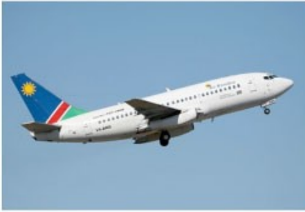
Flug mit der Air Namibia