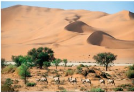
Oryx Antilopen im Sossusvlei

2x Übernachtung mit Halbpension Sense Of Africa (2 Nights Sossusvlei SOL-G)