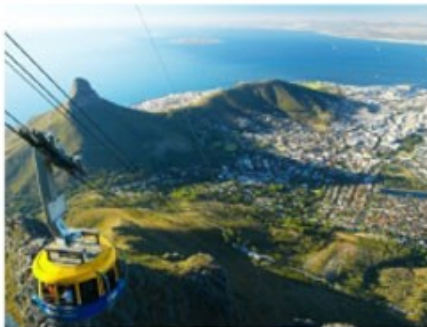
Seilbahn auf den Tafelberg

Sie starten zu einer Halbtagestour auf den Tafelberg und in die City von Kapstadt. Das Seilbahnticket ist nicht im Preis inklusive, da der Tafelberg witterungsbedingt gesperrt sein kann. Anschließend besuchen Sie das bunte Bo-Kaap-Viertel, das Castle of Good Hope und eine Diamantenmine. Von Milnerton aus haben Sie einen perfekten (Foto-)Blick auf den Tafelberg und die Bucht von Kapstadt.