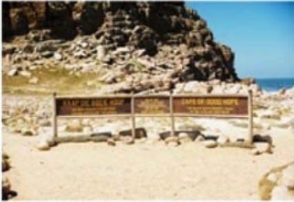
Kap der Guten Hoffnung

Sie starten zu einem Ganztagesausflug auf die Kaphalbinsel. Sie besuchen den Botanischen Garten von Kirstenbosch, den Cape of Good Hope Nationalpark mit dem Kap der Guten Hoffnung und die berühmte Pinguinkolonie von Boulders Beach. Über den Chapmans Peak Drive, eine der schönsten Küstenstraßen der Welt, geht es weiter nach Hout Bay mit seinem kleinen Fischerhafen. Über Sea Point geht es zurück nach Kapstadt.