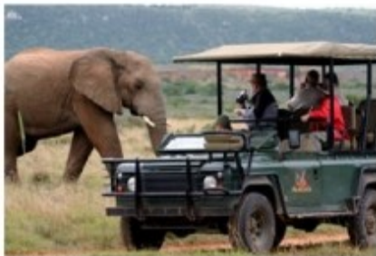
Pirschfahrt im Amakhala Wildreservat

2x Übernachtung mit Vollpension und 4 Aktivitäten Amakhala Game Reserve (Bush Lodge Luxury Suite) - optional gegen Aufpreis buchbar