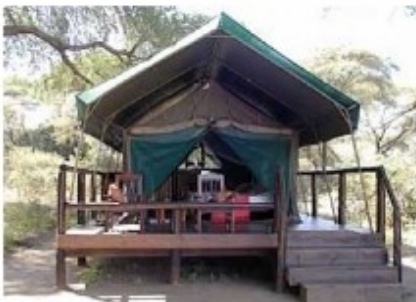
Zeltsuite des Camps

Im Herzen des Amakhala Wildreservats liegt das neue Woodbury Tented Camp, ein intimes und friedliches Erlebnis im typischen ostkapschem Buschland (bekannt als „riverine bushveld“), mit tollem Ausblick auf die Umgebung. Pro Übernachtung unternehmen Sie zwei geführte Pirschfahrten im offenen Geländewagen, um den Big Five auf die Spur zu kommen. (8 Zeltsuiten: Bad/WC, Ventilator, Veranda. Camp: Bar, Lounge mit Außenterrasse, Boma = traditioneller Essensplatz am Lagerfeuer, sicheres Parken, Tierbeobachtungsaktivitäten)