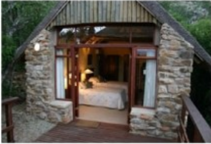
Chalet der Woodbury Lodge

Ganz in der Nähe des berühmten Addo Elephant Parks liegt das private Wildreservat Amakhala in einer malariafreien Umgebung. Das Reservat beherbergt die Big Five, also Löwen, Leoparden, Elefanten, Büffel und Nashörner, aber natürlich auch viele weitere afrikanische Wildtiere. Für einen kurzen Aufenthalt sind die privaten Wildreservate für gute Tierbeobachtungen am besten geeignet.