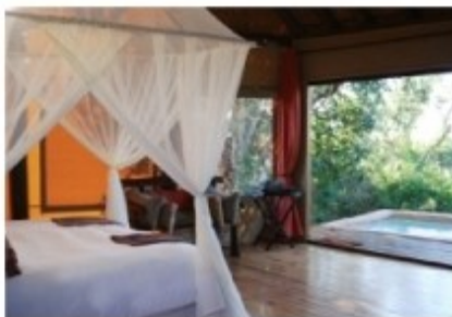
Zelt-Suite der Reed Valley Bush Lodge

In der Nähe des Addo Elephant Parks liegt das private Wildreservat Amakhala in einer malariafreien Umgebung. Das Reservat beherbergt die Big Five, also Löwen, Leoparden, Elefanten, Büffel und Nashörner, aber natürlich auch viele weitere afrikanische Wildtiere. Das 7000ha große Reservat am Bushmans River bietet eine wunderschöne typisch ostkap'sche Landschaft.