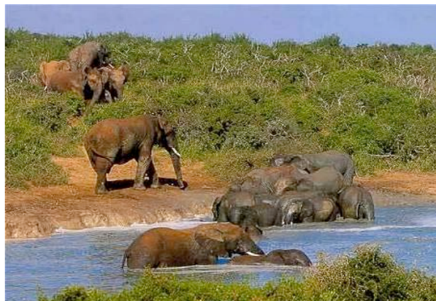
Addo Elephant Park