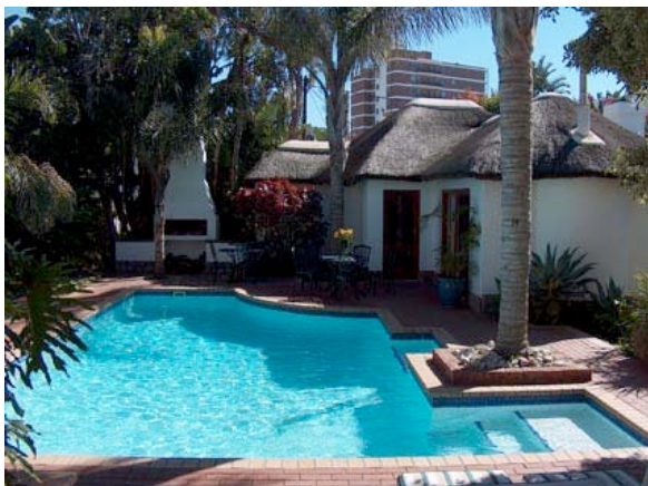
Gästehaus in Port Elizabeth

Der Vormittag steht Ihnen zur freien Verfügung. Passend zu Ihrem Rück- oder Weiterflug werden Sie zum Flughafen von Port Elizabeth gefahren.