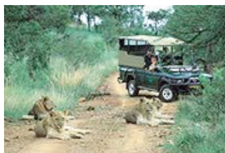
Pirschfahrt im Pilanesberg