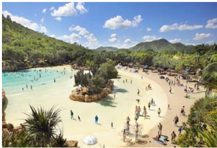
Valley Of The Waves