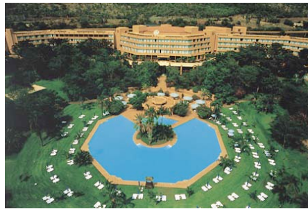
Sun City Main Hotel