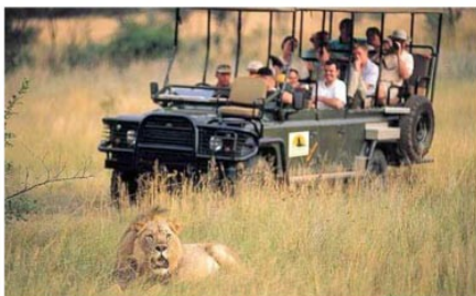
Pirschfahrt im Entabeni Game Reserve

2x Übernachtung mit Vollpension und 4 Aktivitäten Entabeni Wildside Safari Camp (Tented Chalet)