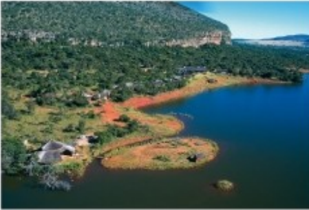
Lakeside Lodge Entabeni Game Reserve

In der malariefreien Waterberg-Region liegt das 22000ha große Entabeni Game Reserve, welches neben vielen anderen Wildtieren auch die Big Five beheimatet. Die Region besticht durch einmalige Landschaften und abwechslungsreiche Natur. Berge, Schluchten, Steppen und Seen bieten auf engem Raum ein Abbild vieler ursprünglicher afrikanischer Gebiete. Die Waterberg-Region gilt immer noch als Geheimtipp in Südafrika.