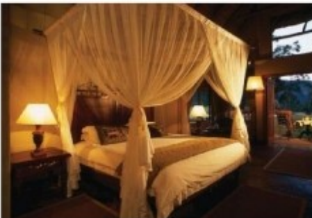
Suite der Hanglip Mountain Lodge

In der malariefreien Waterberg-Region liegt das 22000ha große Entabeni Game Reserve, welches neben vielen anderen Wildtieren auch die Big Five beheimatet. Die Region besticht durch einmalige Landschaften und abwechslungsreiche Natur. Berge, Schluchten, Steppen und Seen bieten auf engem Raum ein Abbild vieler ursprünglicher afrikanischer Gebiete. Die Waterberg-Region gilt immer noch als Geheimtipp in Südafrika.