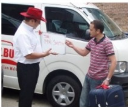
Transfer mit Meet&Greet

Bei Transfers ab Ihrem Hotel werden Sie zu der auf dem Voucher genannten Zeit in der Lobby Ihres Hotels abgeholt.