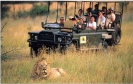
Pirschfahrt im Entabeni Game Reserve

2x Übernachtung mit Vollpension und 4 Aktivitäten Hanglip Mountain Lodge (Luxury Room) - optional gegen Aufpreis buchbar