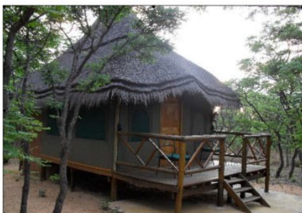
Wildside Tented Camp

Das Wildside Tented Camp befindet sich im Lower Escarpement des Reservates. Pro Übernachtung nehmen Sie an zwei geführten Pirschfahrten im offenen Geländewagen teil. Bei gutem Wetter wird das Abendessen am offenen Lagerfeuer serviert. Das Camp besteht 20 Zelt-Chalets, die im afrikanischen Stil eingerichtet sind, haben: Bad/WC, Ventilator, Fön, Minibar, Tee/Kaffe Zubereiter, private Veranda.