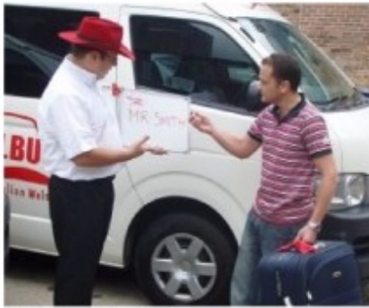
Transfer mit Meet&Greet

Bei Transfers ab Ihrem Hotel werden Sie zu der auf dem Voucher genannten Zeit in der Lobby Ihres Hotels abgeholt.