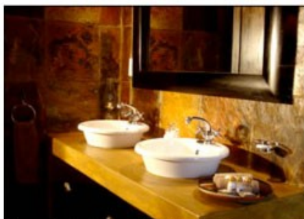
Zimmerbeispiel der Shiduli Safari Lodge

Ihr Ziel ist ein privates Wildreservat (Private Game Reserve) am Krügerpark. Im Gegensatz zum staatlich geführten Krüger Park haben nur Übernachtungsgäste Zutritt zu den privaten Reservaten. Die kleinen Lodges haben eine sehr persönliche Atmosphäre. Speziell ausgebildete Ranger sorgen für ein Naturerlebnis erster Klasse. Für einen kurzen Aufenthalt ist ein privates Wildreservat die beste Möglichkeit, gute Tierbeobachtungen zu machen.