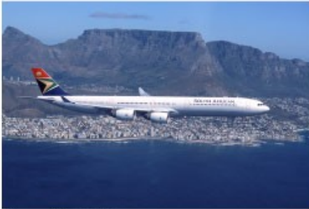
Flug mit der SAA

South African Airways, kurz SAA, ist die größte nationale und internationale südafrikanische Fluggesellschaft mit Sitz in Kempton Park und Mitglied der Luftfahrtallianz Star Alliance. Sie unterhält Drehkreuze in Johannesburg und Kapstadt sowie Kooperationen mit den Regionalgesellschaften Airlink und South African Express.