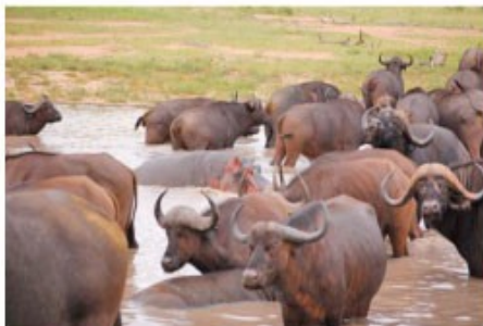
Büffel im privaten Wildreservat

3x Übernachtung mit Vollpension und 5,000001 Aktivitäten Drifters Game Lodge (Three Nights Package incl. Transfer)