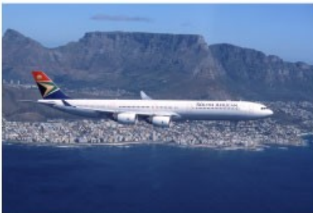
Flug mit der SAA

Flight Cape Town-Hoedspruit - optional gegen Aufpreis buchbar