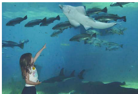
uShaka Marine World

Vormittags steht Ihnen noch etwas Zeit zur freien Verfügung. Passend zu Ihrem Rück- oder Weiterflug werden Sie zum Flughafen von Durban gefahren.