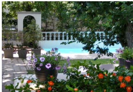
Trevoyan Guest House