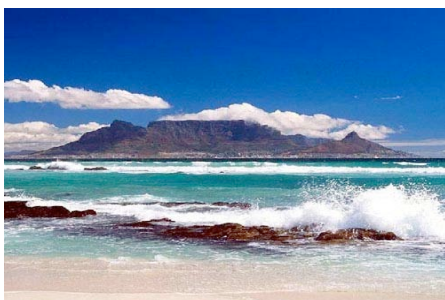
Blick auf den Tafelberg

Nach dem Frühstück haben Sie noch etwas Zeit zur freien Verfügung. Passend zu Ihrem Rück- oder Weiterflug werden Sie zum Flughafen von Kapstadt gefahren.