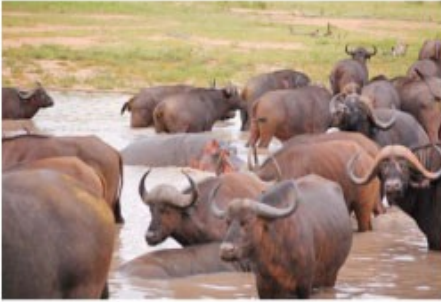
Büffel im privaten Wildreservat

4x Übernachtung mit Vollpension und 6 Aktivitäten Drifters Game Lodge (Four Nights Package incl. Transfer)