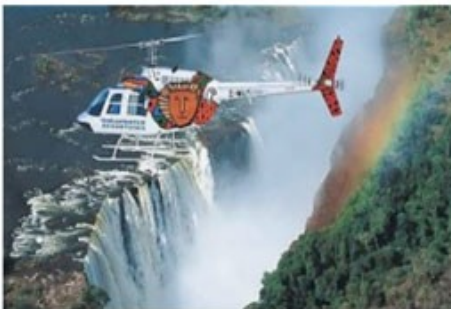
Helicopter Flug über die Vic Falls

12-min Helicopter Flight - optional gegen Aufpreis buchbar