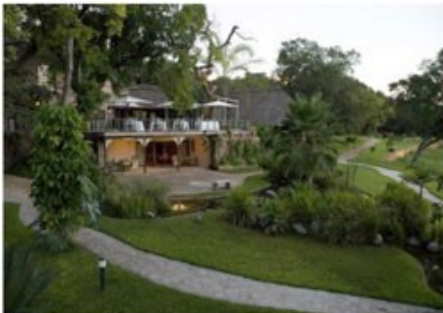
Stanley & Livingstone Hotel

Die Viktoriafälle im Norden an der Grenze zu Zambia sind mit Sicherheit das Highlight des Landes, wenn nicht sogar des ganzen afrikanischen Kontinents. Auf über einem Kilometer Länge stürzt der mächtige Zambezi River abrupt über 100m in die Tiefe in eine nur noch 50m breite Schlucht. Ein Naturwunder, welches seines Gleichen sucht. In der Regenzeit zwischen November und April fließen hier rund zehn Millionen Liter Wasser pro Sekunde über den Felsrand. Der entstehende Sprühnebel der Wasserfälle kann bis zu 400 Meter in die Höhe steigen und erzeugt in unmittelbarer Nähe einen üppigen Urwald, verdeckt aber auch ein wenig die Sicht. In der Trockenzeit fließt deutlich weniger Wasser, dafür fehlt aber auch meist der störende Nebel. Der touristische Ort Victoria Falls bietet darüber hinaus eine Vielzahl von Aktivitäten wie Sunset Cruises auf dem oberen Teil des Zambezi River, Kanufahrten, Wild Water Rafting, Bungee Jumping, Rundflüge über die Wasserfälle, Elephant Back Safaris und vieles mehr.