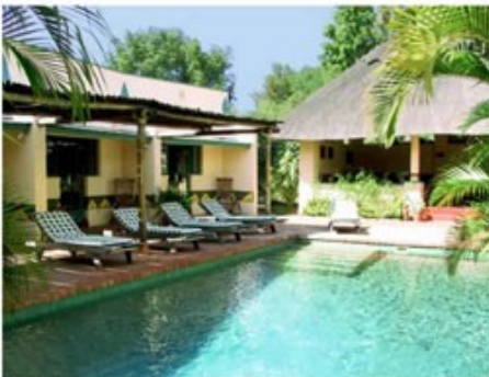
Pool der Lodge

Die Viktoriafälle im Norden an der Grenze zu Zambia sind mit Sicherheit das Highlight des Landes, wenn nicht sogar des ganzen afrikanischen Kontinents. Auf über einem Kilometer Länge stürzt der mächtige Zambezi River abrupt über 100m in die Tiefe in eine nur noch 50m breite Schlucht. Ein Naturwunder, welches seines Gleichen sucht. In der Regenzeit zwischen November und April fließen hier rund zehn Millionen Liter Wasser pro Sekunde über den Felsrand. Der entstehende Sprühnebel der Wasserfälle kann bis zu 400 Meter in die Höhe steigen und erzeugt in unmittelbarer Nähe einen üppigen Urwald, verdeckt aber auch ein wenig die Sicht. In der Trockenzeit fließt deutlich weniger Wasser, dafür fehlt aber auch meist der störende Nebel. Der touristische Ort Victoria Falls bietet darüber hinaus eine Vielzahl von Aktivitäten wie Sunset Cruises auf dem oberen Teil des Zambezi River, Kanufahrten, Wild Water Rafting, Bungee Jumping, Rundflüge über die Wasserfälle, Elephant Back Safaris und vieles mehr.