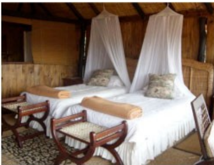
Chalet der Lodge

Der etwa 15000 qm große Nationalpark liegt in den Ausläufern der Kalahari und ist das bedeutendste Naturschutzgebiet Zimbabwes, in dem eine dichte Tierpopulation lebt. Über 20000 Elefanten, 17000 Büffel, 6000 Impalas, 5000 weitere Antilopen und Kudus, sowie 3000 Giraffen wurden zuletzt gezählt, aber auch Geparden, Leoparden, Löwen, Wasserböcke und andere Tiere des südlichen Afrikas können Sie hier finden. Das ganze Gebiet ist eine nahezu ebene Savanne, mit wenigen natürlichen Wasserlöchern und vor allem im Westen mit spärlicher Vegetation bedeckt. Die beste Zeit für gute Tierbeobachtungen ist die Trockenzeit im Winter von Mai bis Oktober.