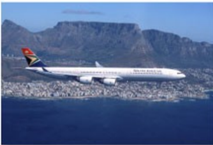
Flug mit der SAA

South African Airways, kurz SAA, ist die größte nationale und internationale südafrikanische Fluggesellschaft mit Sitz in Kempton Park und Mitglied der Luftfahrtallianz Star Alliance. Sie unterhält Drehkreuze in Johannesburg und Kapstadt sowie Kooperationen mit den Regionalgesellschaften Airlink und South African Express.