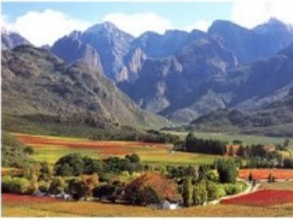
Weingebiete im Western Cape

Sie starten zu einer Halbtagestour in die berühmten Weingebiete des Western Capes, alleine schon landschaftlich ein Höhepunkt. Sie besuchen die historischen Städtchen Paarl, Franschhoek und Stellenbosch und machen auch einen Stopp für eine Weinprobe auf einem lokalen Weingut.