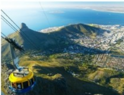
Seilbahn auf den Tafelberg

Sie starten zu einer Halbtagestour auf den Tafelberg und in die City von Kapstadt. Das Seilbahnticket ist nicht im Preis inklusive, da der Tafelberg witterungsbedingt gesperrt sein kann. Anschließend besuchen Sie das bunte Bo-Kaap-Viertel, das Castle of Good Hope und eine Diamantenmine. Von Milnerton aus haben Sie einen perfekten (Foto-)Blick auf den Tafelberg und die Bucht von Kapstadt.