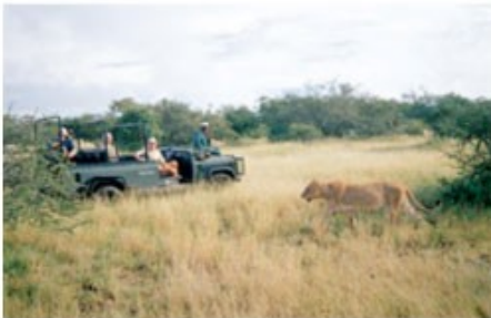
Pirschfahrt im offenen Geländewagen

3x Übernachtung mit Vollpension und 5 Aktivitäten Kuname River Lodge (Three Nights Package incl. Transfer) - optional gegen Aufpreis buchbar