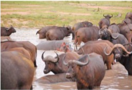
Büffel im privaten Wildreservat

3x Übernachtung mit Vollpension und 5 Aktivitäten Drifters Game Lodge (Three Nights Package incl. Transfer)