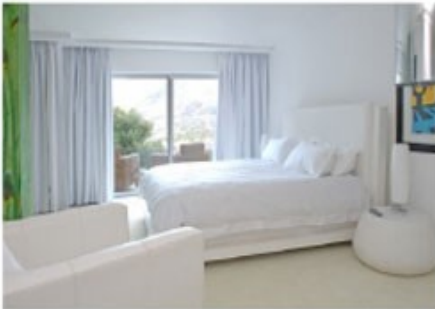
Suite des Gästehauses

Willkommen in der Mother City. Kapstadt ist wohl eine der schönsten Städte der Welt. Ihr erster Ausflug sollte auf den Tafelberg gehen, damit Sie sich erstmal einen Überblick verschaffen können. Ein Muss ist auch die Fahrt über den Chapman's Peak Drive, einer beeindruckenden Küstenstraße, die vorbei an der Pinguin-Kolonie von Boulders Beach bis zum Kap der guten Hoffnung führt. Kapstadt ist aber auch ein Shopping-Paradies. Die V&A-Waterfront lädt ein mit unzähligen Geschäften und Restaurants. Hier starten auch die Fähren zur ehemaligen Gefängnisinsel Robben Island. Im Gegensatz zu anderen Großstädten Südafrikas ist die Innenstadt von Kapstadt relativ sicher, sodass Sie einen Bummel vom Museumsbezirk zum bunten Bo-Kaap-Viertel nicht auslassen sollten.