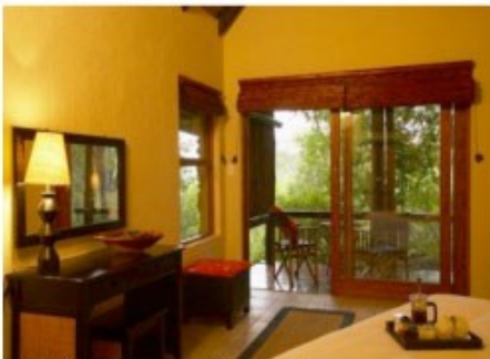
Chalet der Kuname River Lodge

Ihr Ziel ist das 9000ha großes private Karongwe Wildreservat am Krüger Park. Im Gegensatz zum staatlichen Krüger Park haben nur Übernachtungsgäste Zutritt zu den privaten Reservaten. Die Ranger sorgen für ein Naturerlebnis aller erster Klasse. Hier haben Sie beste Chancen, die Big Five und alle weiteren afrikanischen Wildtiere zu entdecken.