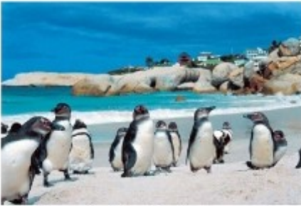
Pinguine am Boulders Beach

Sie starten zu einem Ganztagesausflug auf die Kaphalbinsel. Sie besuchen den Botanischen Garten von Kirstenbosch, den Cape of Good Hope Nationalpark mit dem Kap der Guten Hoffnung und die berühmte Pinguinkolonie von Boulders Beach. Über den Chapmans Peak Drive, eine der schönsten Küstenstraßen der Welt, geht es weiter nach Hout Bay mit seinem kleinen Fischerhafen. Über Sea Point geht es zurück nach Kapstadt.