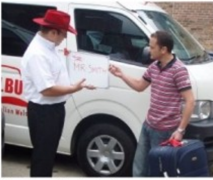
Transfer mit Meet&Greet

Bei Transfers ab Ihrem Hotel werden Sie zu der auf dem Voucher genannten Zeit in der Lobby Ihres Hotels abgeholt.