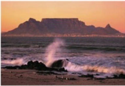
Table Mountain bei Sonnenuntergang

3x Übernachtung mit Frühstück Boutique Manolo (Luxury Grand Suites) - optional gegen Aufpreis buchbar