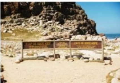
Kap der Guten Hoffnung

Sie starten zu einem Ganztagesausflug auf die Kaphalbinsel. Sie besuchen den Botanischen Garten von Kirstenbosch, den Cape of Good Hope Nationalpark mit dem Kap der Guten Hoffnung und die berühmte Pinguinkolonie von Boulders Beach. Über den Chapmans Peak Drive, eine der schönsten Küstenstraßen der Welt, geht es weiter nach Hout Bay mit seinem kleinen Fischerhafen. Über Sea Point geht es zurück nach Kapstadt.