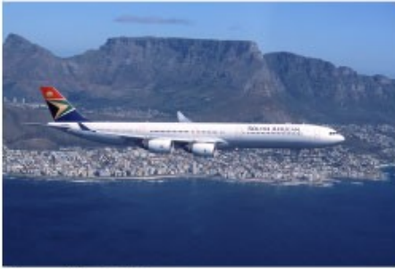
Flug mit der SAA