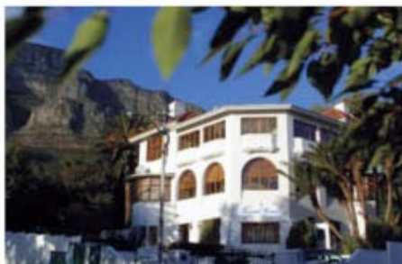
Gästehaus unterhalb des Tafelberges

Willkommen in der Mother City. Kapstadt ist wohl eine der schönsten Städte der Welt. Ihr erster Ausflug sollte auf den Tafelberg gehen, damit Sie sich erstmal einen Überblick verschaffen können. Ein Muss ist auch die Fahrt über den Chapmans Peak Drive, einer beeindruckenden Küstenstraße, die vorbei an der Pinguin-Kolonie von Boulders Beach bis zum Kap der guten Hoffnung führt. Kapstadt ist aber auch ein Shopping-Paradies. Die V&A-Waterfront lädt ein mit unzähligen Geschäften und Restaurants. Hier starten auch die Fähren zur ehemaligen Gefängnisinsel Robben Island. Im Gegensatz zu anderen Großstädten Südafrikas ist die Innenstadt von Kapstadt relativ sicher, sodass Sie einen Bummel vom Museumsbezirk zum bunten Bo-Kaap-Viertel nicht auslassen sollten.