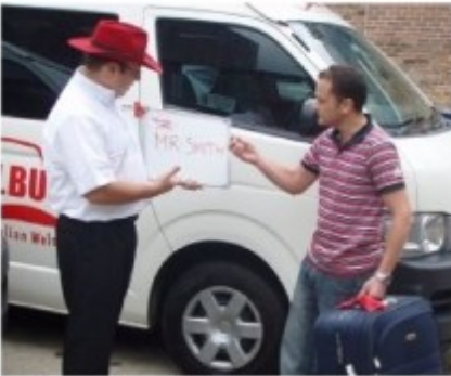
Transfer mit Meet&Greet

Bei Transfers ab Ihrem Hotel werden Sie zu der auf dem Voucher genannten Zeit in der Lobby Ihres Hotels abgeholt.