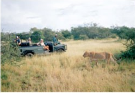
Pirschfahrt im offenen Geländewagen

3x Übernachtung mit Vollpension und 5 Aktivitäten Shiduli Safari Lodge (Three Nights Package incl. Transfer) - optional gegen Aufpreis buchbar