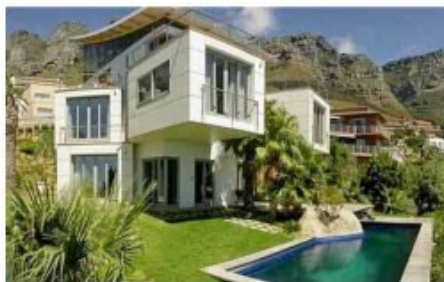
Exklusiv für SA Travel Kunden: Lobster House

3x Übernachtung mit Frühstück Lobster House (Standard Room) - optional gegen Aufpreis buchbar