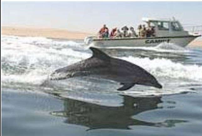
Delphine begleiten das Boot