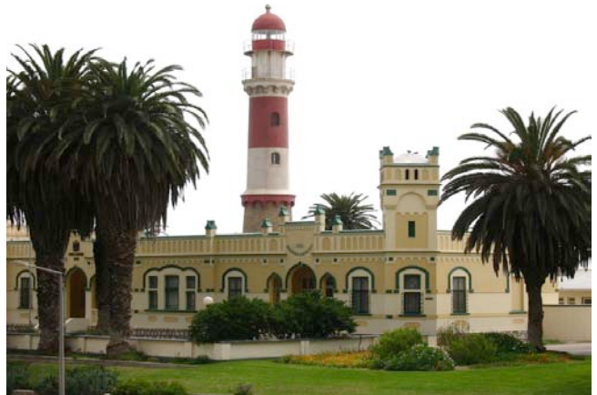
Leuchtturm von Swakopmund