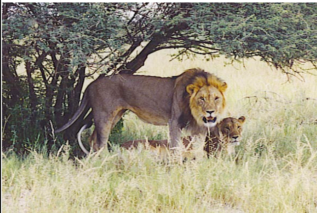
Löwen im Etosha