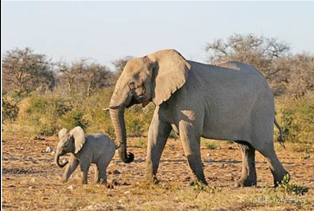
Elefanten im Etosha

Die im Kolonialstil eingerichtete Lodge befindet sich ca. 2 Kilometer vom Camp entfernt und ist auf einer Anhöhe gelegen. Von hier haben Sie einen idealen Startpunkt für Ausflüge in den Nationalpark. Sie bietet einen herrlichen Blick über bewachsene Hügel in Richtung Etosha Nationalpark und einen exzellenten Service. Zu den vielen Annehmlichkeiten gehören unter anderem ein gemütliches Restaurant mit einer großen Terrasse, eine Bar, drei Pools und ein üppiger Garten. Die Zimmer verfügen über Bad/WC.