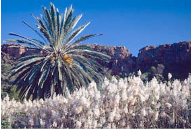
Waterberg Plateau N.P.

Das ehemalige, im Jahre 1930 erbaute Haus des Farmverwalters, wurde in ein Gästehaus mit vier Gästezimmern umgebaut, die alle über ein eigenes Bad verfügen. Jedes Zimmer hat einen eigenen Eingang, der auf die große Veranda führt.