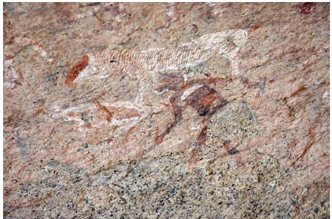
Buschmannszeichnungen am Brandberg