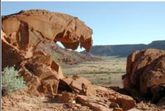
Die „Welle“ von Twyfelfontein

Heute endet Ihre Reise in der schönen Twyfelfontein Country Lodge. Eingebettet in interessante Felsformationen befindet sich das mit Stroh gedeckte und im afrikanischen Stil gehaltene Hauptgebäude. Zu den Einrichtungen der Lodge zählen ein Swimmingpool, eine Bar, ein Restaurant, eine gemütliche Gästelounge sowie ein Souvenir Shop. Alle Zimmer sind ausgestattet mit einem Deckenventilator und Badezimmer mit Dusche/WC.