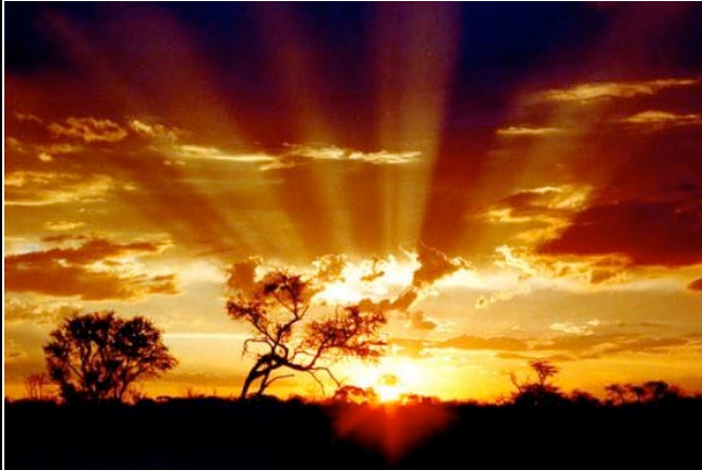
Sonnenuntergang in der Kalahari

Sie wohnen in der schönen Anib Lodge. Die Unterkünfte aus kalahari-rottem Backstein gruppieren sich harmonisch um einen großzügigen Innenhof mit Palmen, Akazien und einem außergewöhnlichen Sukkulentengarten. Der große Pool lädt zu einem erfrischenden Bad im kühlen Nass ein. Die Doppelzimmer mit Dusche/WC, Klimaanlage und Ventilator gruppieren sich um einen schattigen Innenhof mit großem Pool und eigener Veranda.