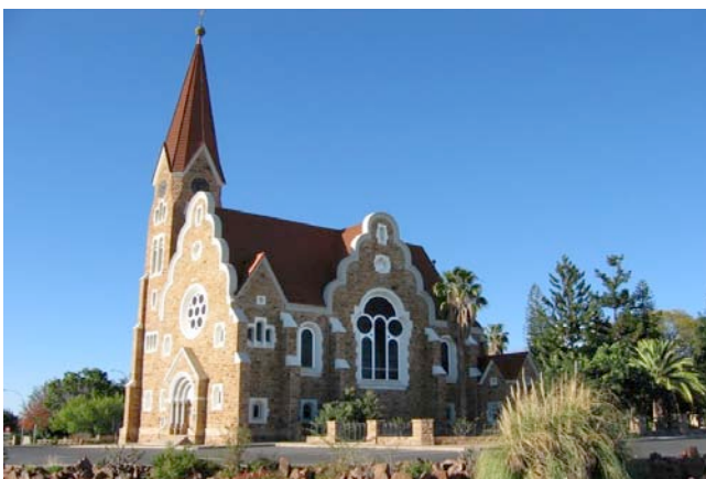
Christuskirche in Windhoek

Am heutigen werden Sie passend zu Ihrem Rückflug zum Flughafen von Windhoek gefahren. Sie verabschieden sich von Ihrer Reiseleitung und treten den Flug zurück nach Deutschland an.