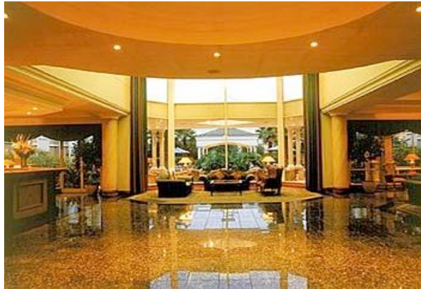
Airport Grand Hotel