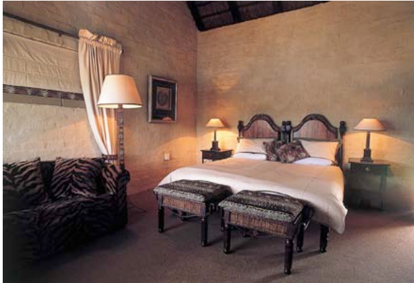
Zimmer der Lakeside Lodge

Sie übernachten in der schönen Lakeside Lodge. Alle Zimmer haben Bad/WC, Ventilator, Tee/Kaffeezubereiter, Telefon, Veranda. Die Lodge verfügt über ein Restaurant, eine Bar, einen Pool und einen Boma (traditioneller Essensplatz am Lagerfeuer). Außerdem gibt es einen Wellness- und Spa-Bereich, der von allen Gästen des Reservates genutzt werden kann (gegen Gebühr).