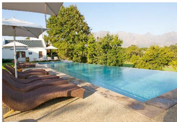
Pool mit Blick auf die Weinberge