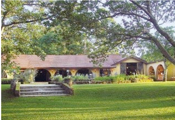
Böhms Zeederberg Gästehaus

Sie übernachten im schönen Böhms Zeederberg Landgästehaus etwas außerhalb von Sabie im wunderschönen Sabie River Tal. Alle Zimmer haben: Bad/WC, Klimaanlage, Tee/Kaffeemaschine, Minibar und Veranda. Die Unterkunft verfügt über Pool, Restaurant, Bar, Kaminlounge, Gartenanlage und Weinkeller.