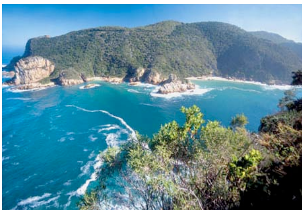
Eingang zur Lagune von Knysna

Das Bradach Manor ist ein schönes Gästehaus, welches tolle Ausblicke über die Lagune und die dichten Wälder des Hinterlands bietet. Die Zimmer haben Bad/WC, TV, Tee/Kaffeezubereiter, Ventilator, Minibar. Das Gästehaus bietet einen Pool, ein Restaurant, eine Bar und einen Garten.