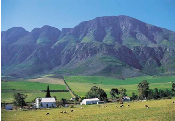
Auf der R62 durch die kleine Karoo

Sie bernachten im Mooiplaas Gstehaus, welches sich auf einer Strauenfarm befindet. Die 13 Zimmer verfgen ber Bad/WC, Klimaanlage, Khlschrank, Safe, TV, Telefon, Tee/Kaffeezubereiter, Fhn, W-Lan. Das Gstehaus bietet einen Pool und ein Restaurant.