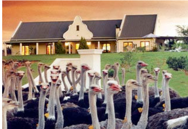
Das Mooiplaas Gstehaus