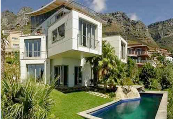
Exklusiv für SA Travel Kunden: Lobster House

Im noblen Atlantikvorort Camps Bay mit der Bergkette der mächtigen Twelve Apostels im Rücken sowie einem atemberaubenden Blick auf den Ozean liegt dieses architektonische Kleinod, welches unter den vielen Gästehäusern Kapstadts seines Gleichen sucht. (6 Zimmer: Bad/WC, Klimaanlage, TV, Radio/CD. Gästehaus: Pool, Garten, Lounge, Terrasse, Bar)