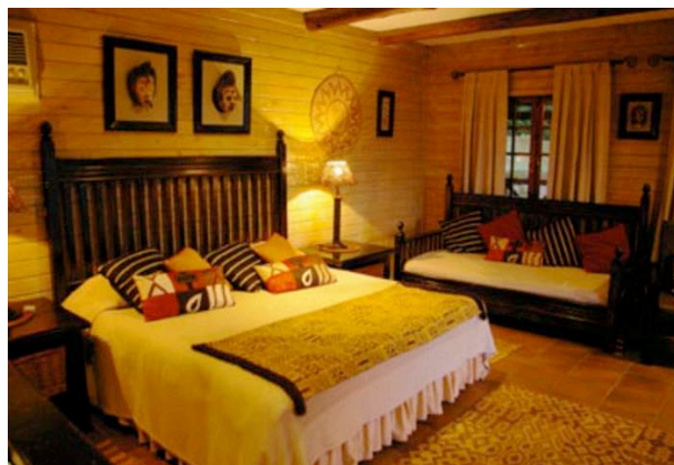
Zimmer im Böhms Zeederberg

Übernachtung mit Halbpension im Böhms Zeederberg Gästehaus