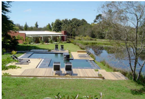
Die Lily Pond Country Lodge