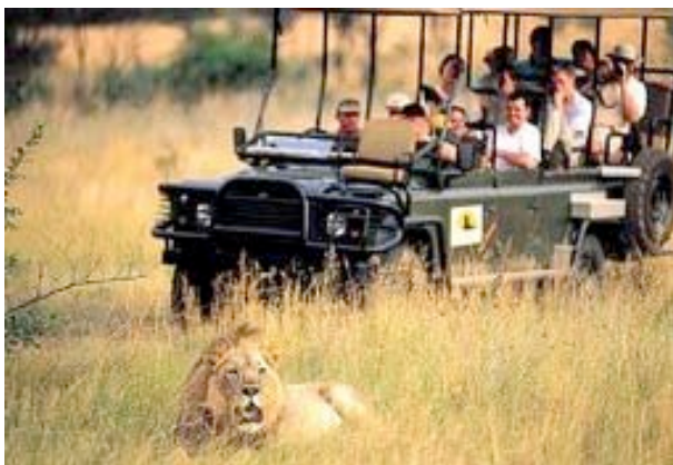
Pirschfahrt im offenen Geländewagen

Sie übernachten in der schönen Lakeside Lodge. Alle Zimmer haben Bad/WC, Ventilator, Tee/Kaffeezubereiter, Telefon, Veranda. Die Lodge verfügt über ein Restaurant, eine Bar, einen Pool und einen Boma (traditioneller Essensplatz am Lagerfeuer). Außerdem gibt es einen Wellness- und Spa-Bereich, der von allen Gästen des Reservates genutzt werden kann (gegen Gebühr).