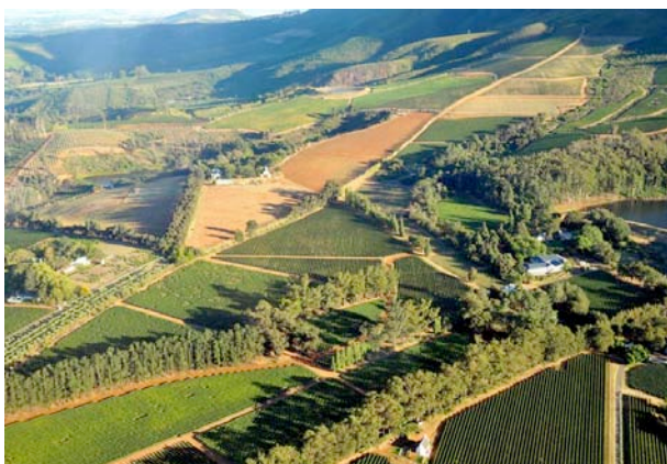
Weinregion bei Stellenbosch

Sie wohnen auf dem Kleinen Zalze Weingut, einem gemütlichen Familienbetrieb mit angeschlossener Lodge und Golfplatz. Auf dem Gelände befindet sich auch das mehrfach ausgezeichnete Terroir-Restaurant. Die 46 Zimmer verfügen über Bad/WC, Klimaanlage, TV, Telefon, Tee/Kaffeemaschine. Die Lodge bietet einen Pool, Restaurant, Bar, Weinkeller und einen Golfplatz.