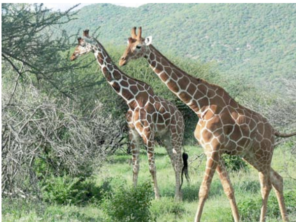
Giraffen im Kruger Park