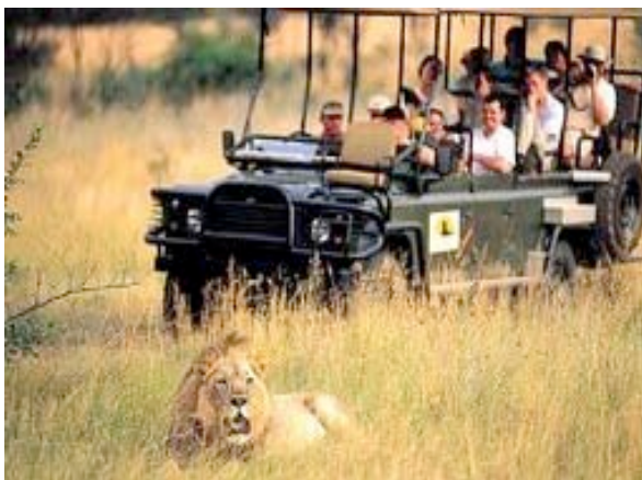
Pirschfahrt im offenen Geländewagen

Das Airport Grand Hotel liegt in der Nähe des Internationalen Flughafens von Johannesburg. Die 149 Zimmer haben alle Bad/WC, Klimaanlage, TV, Telefon, Tee/Kaffeezubereiter, Safe. Das Hotel bietet ein Restaurant, eine Bar und einen Pool.