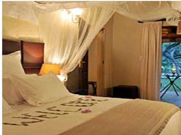
Zimmer der Lodge