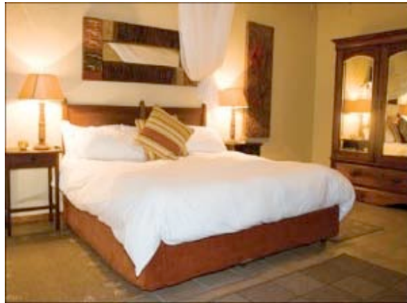
Zimmer in der Hulala Lakeside Lodge