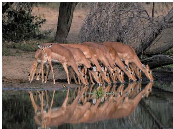
Antilopen an der Wasserstelle