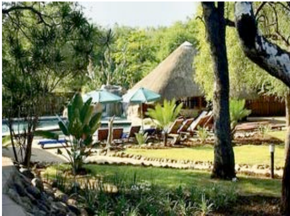
Garten der Lodge

Im privaten Karongwe Wildreservat liegt die luxuriöse und gerade renovierte Shiduli Safari Lodge. Das Reservat beheimatet neben vielen weiteren afrikanischen Wildtieren auch die Big Five. Die Zimmer haben Bad/WC, Moskitonetze, Klimaanlage, Veranda und Telefon. Die Lodge bietet einen Pool, einen Boma = traditioneller Essensplatz, eine Bar und Restaurant.