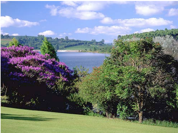
Blick vom Garten auf den See

Direkt am Ufer des Lake Da Game liegt die schöne Hulala Lakeside Lodge. Die 28 Zimmer bieten einen herrlichen Blick auf den See (tlw. Eingeschränkt). Die Zimmer sind ausgestattet mit Bad/WC, TV, Kaffee- und Teezubereitung, Kamin und Terrasse. Die Lodge verfügt über ein Restaurant, einen Pool, große Gartenanlage. Sie haben außerdem die Möglichkeit an zahlreichen Aktivitäten wie zum Beispiel einer Sundowner Cruise auf dem See teilzunehmen.