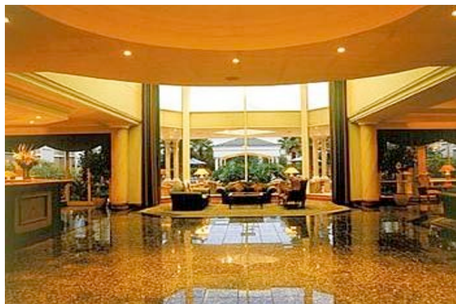
Airport Grand Hotel