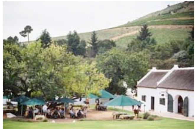
Weingut bei Stellenbosch