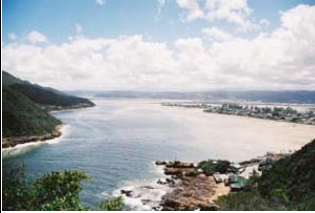
Lagune von Knysna

Nach dem Frühstück starten Sie zu einer Bootstour auf die Lagune von Knysna. Anschließend verlassen Sie die Garden Route über den berühmten Outeniqua-Pass und erreichen das trockene Hinterland der Kleinen Karoo. Oudtshoorn ist das Zentrum der Kleinen Karoo, aufgrund der vielen Straußenfarmen auch Federhauptstadt Südafrikas genannt. Sie besichtigen die berühmten Cango Caves, eine einmalige Tropfsteinhöhlen-Landschaft, bevor Sie Ihre Lodge in karootypischer Bauweise erreichen. (ÜHP La Plume Guest Lodge o.ä.)