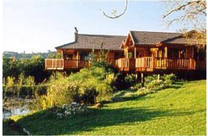
Fish Eagle Lodge in Knysna