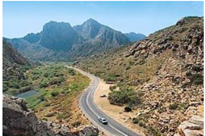
Entlang der berühmten Route 62