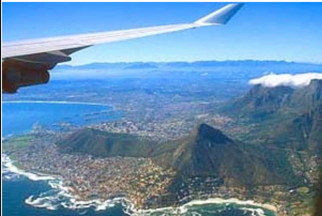
Anflug auf Kapstadt

Nach dem Frühstück werden Sie zum Flughafen von Johannesburg gefahren. Sie fliegen nach Kapstadt (Flugpreis nicht inklusive). Am Flughafen von Kapstadt werden Sie persönlich empfangen und zu Ihrer Unterkunft im Atlantikvorort Sea Point gefahren. Der restliche Tag steht Ihnen zur freien Verfügung. Entdecken Sie die berühmte V&A Waterfront oder die Innenstadt mit dem Company Garden und den vielen Museen. (ÜF Sundown Manor o.ä.)