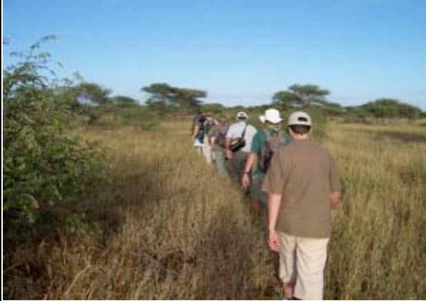
Game Walk mit bewaffneten Rangern

Ein unvergessliches Buscherlebnis erwartet Sie. Zusammen mit zwei bewaffneten erfahrenen Rangern werden Sie die Big Five zu Fuß entdecken. Vier Stunden wandern Sie durch die einmalige Natur und kommen den wilden Tieren Afrikas dabei ganz besonders nah. Zurück an der Lodge haben Sie Zeit, etwas zu entspannen, bevor es nachmittags wieder an Bord eines offenen Geländewagen geht, denn die nächste Pirschfahrt steht an. (ÜHP Tremisana Lodge o.ä.)