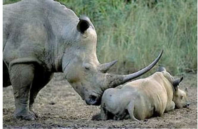
Nashörner im privaten Wildreservat