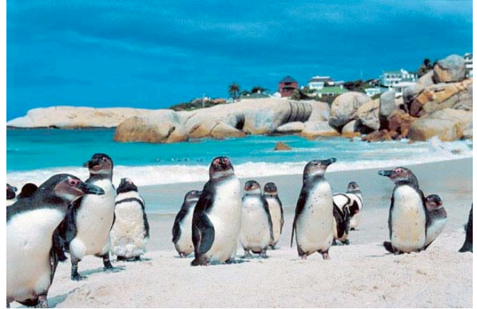
Pinguine am Boulders Beach