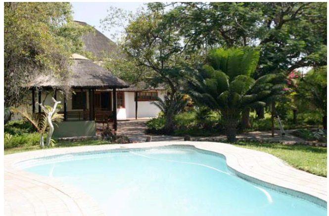
Pool der Lodge