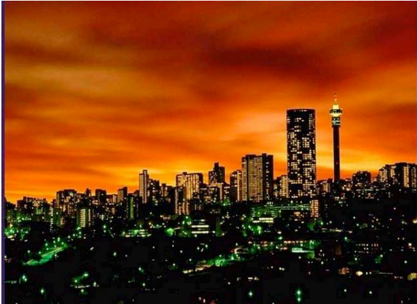
Skyline von Johannesburg

Am Flughafen von Johannesburg werden Sie persönlich empfangen und zu Ihrer Unterkunft in Flughafennähe gefahren. Der Rest des Tages steht Ihnen zur freien Verfügung. In Ihrer Unterkunft können Sie sich vom langen Flug erholen. Optional können Sie eine geführte Nachmittagstour nach Soweto dazubuchen, dem größten und geschichtlich interessantesten Township des Landes. (ÜF MoAfrika Lodge o.ä.)