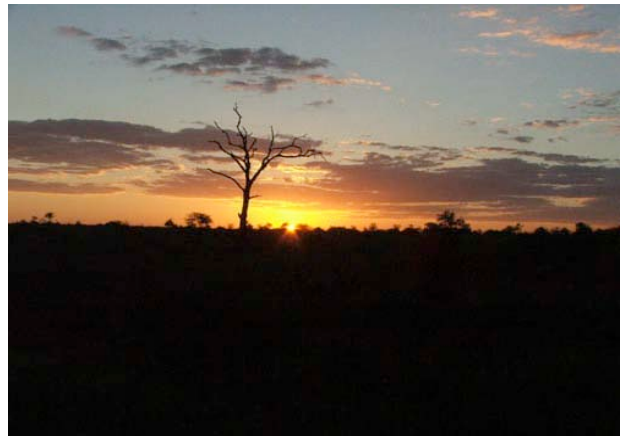
Sonnenuntergang im afrikanischen Busch