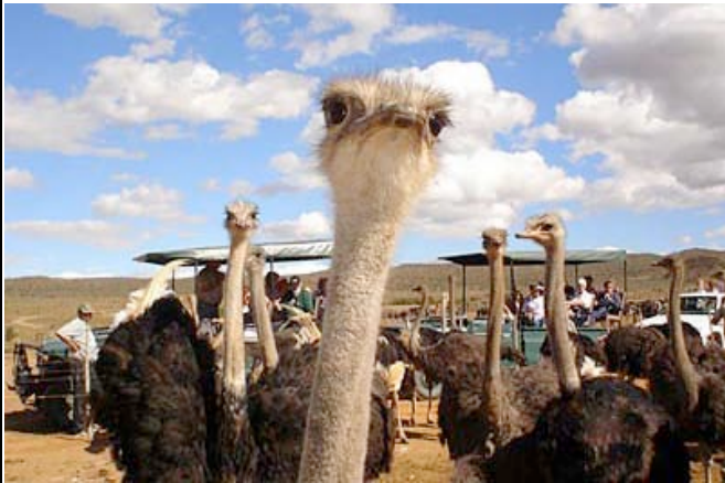
Zu Besuch auf einer Straußenfarm

Bevor Sie Oudtshoorn verlassen, machen Sie noch einen kurzen Stopp auf einer lokalen Straußenfarm und lernen etwas über diese großen flugunfähigen Vögel. Der Weg zurück nach Kapstadt führt Sie über die berühmte Route 62, dem optischen Pendant zur amerikanischen Route 66, vorbei an idyllisch gelegenen Örtchen wie Barrydale, Montagu und Worcester. Am späten Nachmittag erreichen Sie Kapstadt. (ÜF Sundown Manor o.ä.)