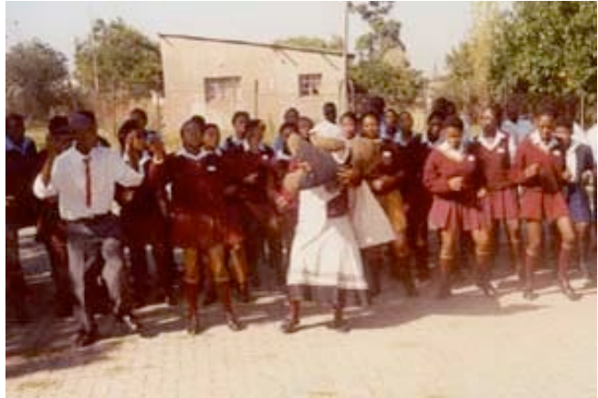
Pulsierendes Leben in Soweto