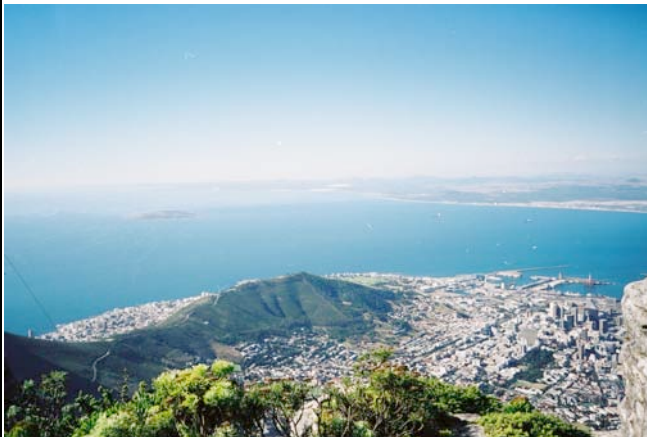
Blick vom Tafelberg

Diese beiden Tage stehen Ihnen in Kapstadt zum Relaxen, Bummeln, Shoppen oder für weitere optionale Ausflüge zur freien Verfügung. Sie können zum Beispiel eine Halbtagestour durch die City und auf den Tafelberg dazubuchen. Oder wie wäre es mit einem Tagesausflug in die berühmten Weingebiete um Stellenbosch, Franschhoek und Paarl, Weinproben inklusive? Von Juli bis November bietet sich auch eine Tagestour an die Walküste bei Hermanus an, wo Sie beste Möglichkeiten zum Beobachten der imposanten Meeressäuger haben. (ÜF Sundown Manor o.ä.)