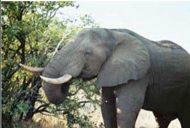
Elefant im Krüger Nationalpark

Früh startet Ihre Fahrt im offenen Geländewagen in den weltbekannten Krüger Nationalpark. Den ganzen Tag über sind Sie im Park unterwegs zu verschiedenen Wasserlöchern, Flussläufen und Staudämmen. Hier sind die Chancen am größten, gute Wildbeobachtungen zu machen. Sie fahren vornehmlich in die Gebiete mit einer großen Tierpopulation. Unterwegs machen Sie Halt für ein kleines Mittagessen (optional). Bei Sonnenuntergang verlassen Sie den Park und machen sich zurück auf den Weg zu Ihrem Camp, wo Sie ein traditionelles Boma-Abendessen erwartet (wetterabhängig). (ÜHP Tremisana Lodge o.ä.)