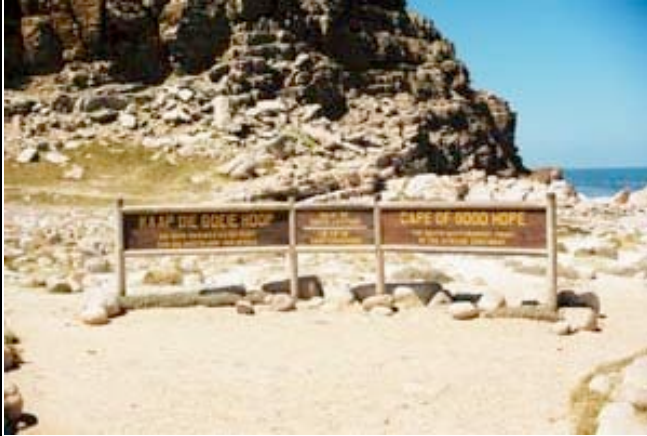
Kap der Guten Hoffnung

Heute machen Sie eine Rundfahrt über die Kaphalbinsel. Es geht in das Fischerdorf Hout Bay, wo Sie kurz anhalten. Von dort aus fahren Sie in das Naturreservat des Kaps. Genießen sie bei Ihrem Aufenthalt den Ausblick auf die Stelle, von der man behauptet, dort trafen sich die beiden Weltmeere Indischer und Atlantischer Ozean. Es geht weiter entlang der False Bay via Simon's Town, wo Sie die Pinguine sehen, und Fish Hoek. Anschließend fahren Sie in die Botanischen Gärten von Kirstenbosch, die den Besucher mit einer Vielzahl einheimischer und exotischer Gewächse begeistern. (ÜF Sundown Manor o.ä.)