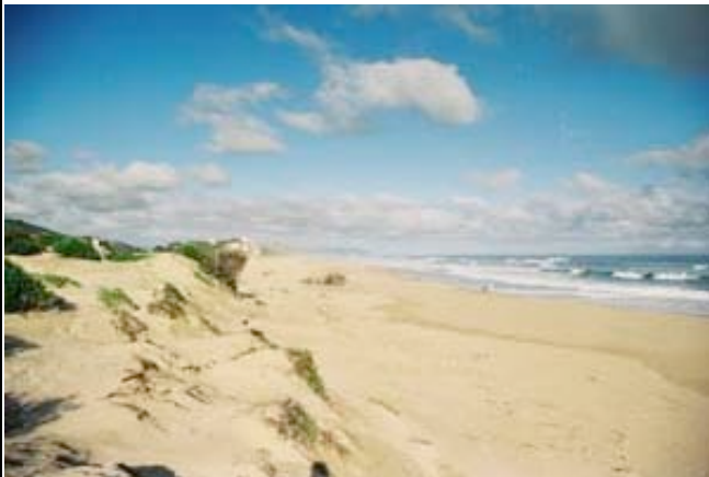
Endlose Strände an der Garden Route

Sie erkunden Knysna und das nahe gelegene Plettenberg Bay. Weiter geht es durch die landschaftlich schönsten Abschnitte der Garden Route in den Tsitsikamma Nationalpark, dem größten zusammenhängenden Urwaldgebiet des südlichen Afrikas durchzogen von mächtigen Flüssen und gesäumt von endlosen einsamen Stränden. Besonders eindrucksvoll ist die Paul Sauer Bridge über den Storms River. Sie besichtigen auch den Big Tree, einen fast tausendjährigen und über 40 Meter hohen Gelbholzbaum. Zurück in Knysna machen Sie einen Abstecher zu den berühmten Heads, die den Eingang der Lagune säumen. (ÜHP Fish Eagle Lodge o.ä.)