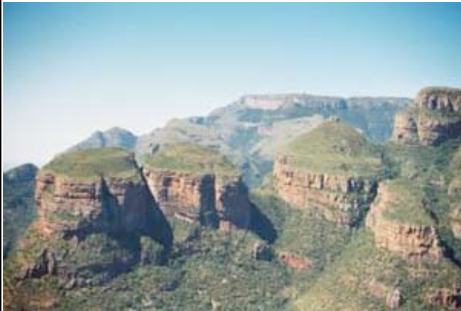
Three Rondawels im Blyde River Canyon

Morgens startet Ihre letzte Pirschfahrt im offenen Geländewagen in den Busch. Es ist Zeit, den wilden Tieren Afrikas Lebewohl zu sagen. Die Rückfahrt führt Sie entlang des Blyde River Canyons zu den berühmten Three Rondawels, wo Sie einen Fotostopp einlegen. Am späten Nachmittag sind Sie wieder zurück in Johannesburg. (ÜF MoAfrika Lodge o.ä.)