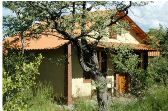
Chalet des Etosha Safari Camps