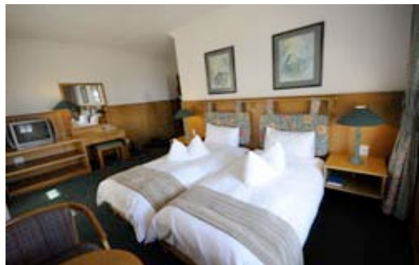
Zimmerbeispiel des Hotel Schweizerhaus