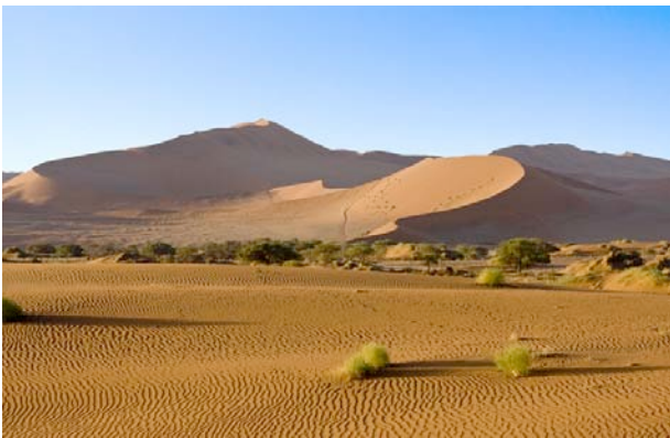
Dünen in der Namibwüste

Die 16 geschmackvoll eingerichteten Zimmer verfügen über ein Badezimmer mit WC und Dusche sowie eine großzügige Terrasse mit wunderbarem Ausblick auf die Wüstenlandschaft.