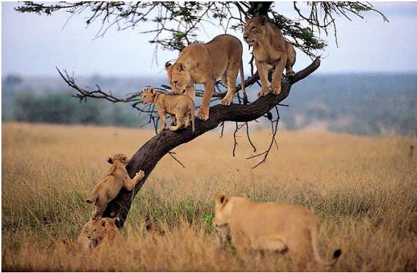
Löwenfamilie im Etosha

Die kommende Nacht verbringen Sie in der kleinen Ohange Lodge. Es gibt 10 einzigartige gestielte "Mountain Huts" an, alle sind en-suite und mit Dachventilator, mit einer Sicht zu den Otavi Bergen und zum Wasserloch.