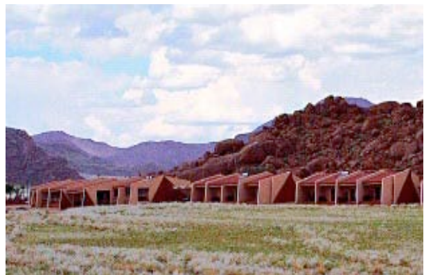
Die Namib Naukluft Lodge