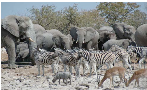
Tiere im Etosha am Wasserloch

Das einfach, aber geschmackvoll eingerichtete Camp befindet sich inmitten eines Mopanewaldes und vermittelt das Gefühl, direkt mit der Natur Afrikas verbunden zu sein. Zu Einrichtungen des Camps gehören ein Pool, eine Bar, ein Internetcafé und ein Garten. Die geräumigen Zimmer verfügen über Dusche/WC und Klimaanlage.