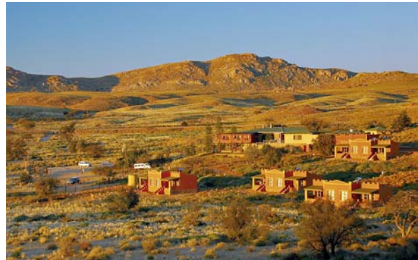
Das Desert Horse Inn