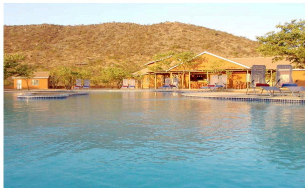
Pool der Damara Mopane Lodge