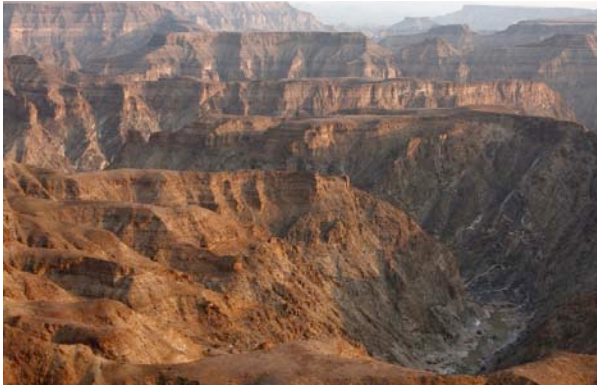
Der Fishriver Canyon

Die 24 geschmackvoll eingerichteten Doppelzimmer des Desert Horse Inn sind geräumig und verfügen über Dusche/WC, Lounge, Kühlschrank und Veranda.