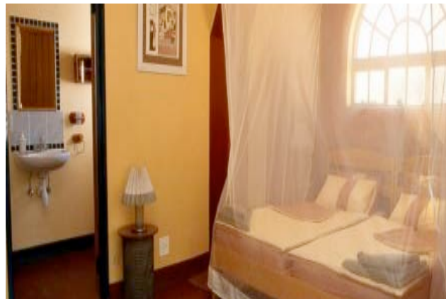
Zimmer im Canon Roadhouse