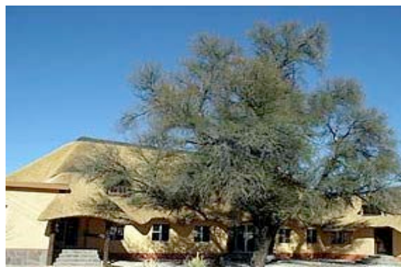
Die Hammerstein Lodge