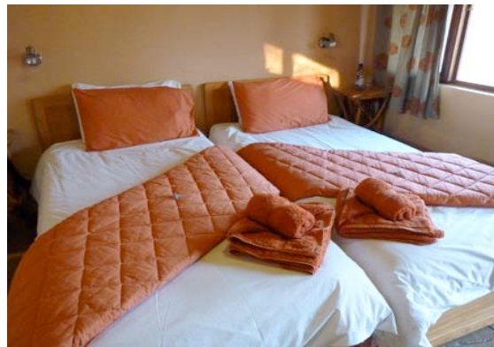
Zimmer der Ohange Lodge