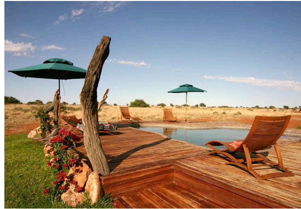
Pool der Anib Lodge