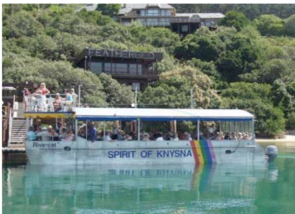
Bootsfahrt zum Featherbed Nature Reserve