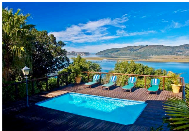
Blick auf die Lagune von Knysna