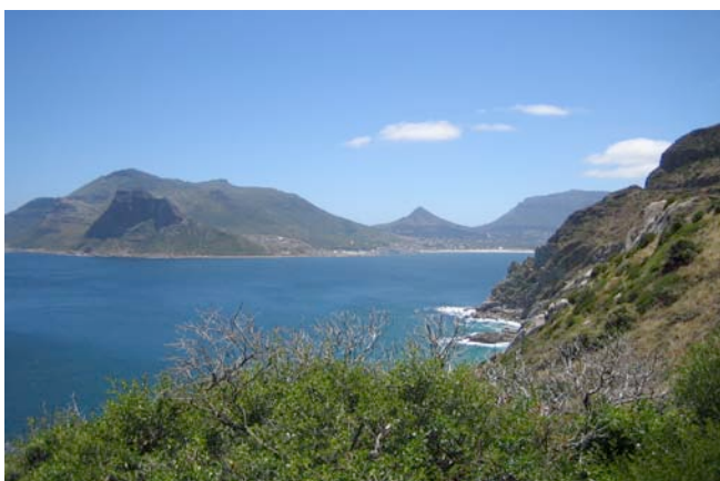
Blick auf Hout Bay