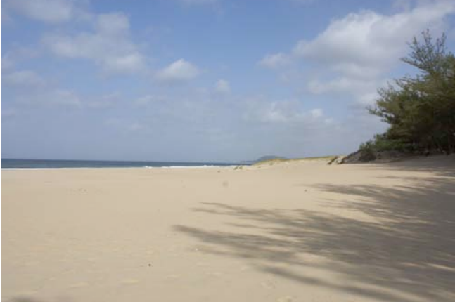
Am Strand von St. Lucia