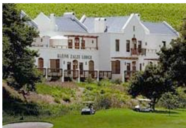
Die Kleine Zalze Lodge