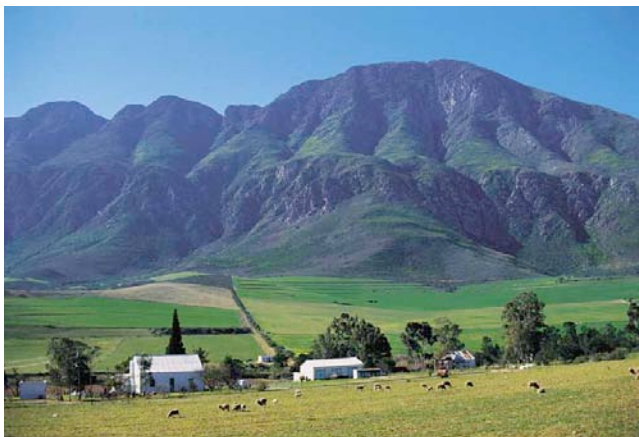
Auf der Route 62 durch die Kleine Karoo

Sie wohnen auf dem Kleine Zalze Weingut, einem gemütlichen Familienbetrieb mit angeschlossener Lodge und Golfplatz. Auf dem Gelände befindet sich auch das mehrfach ausgezeichnete Terroir-Restaurant. Die 46 Zimmer verfügen über Bad/WC, Klimaanlage, TV, Telefon, Tee/Kaffeezubereiter. Die Lodge bietet einen Pool, Restaurant, Bar, Weinkeller, und einen Golfplatz)