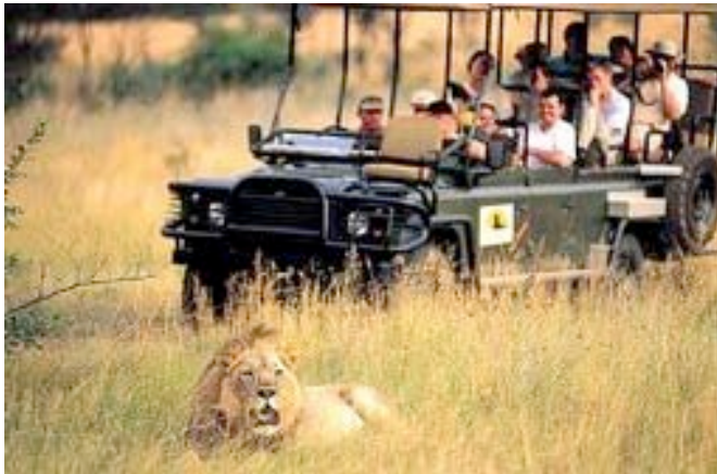
Geführte Pirschfahrt im offenen Geländewagen

Im privaten Karongwe Wildreservat liegt die luxuriöse und gerade renovierte Shiduli Safari Lodge. Das Reservat beheimatet neben vielen weiteren afrikanischen Wildtieren auch die Big Five. Die Zimmer haben Bad/WC, Moskitonetze, Klimaanlage, Veranda und Telefon. Die Lodge bietet einen Pool, einen Boma = traditioneller Essensplatz, eine Bar und Restaurant.