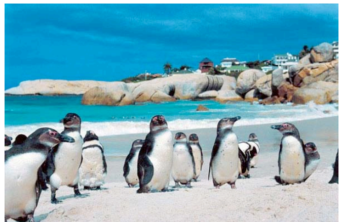
Pinguine am Boulders Beach