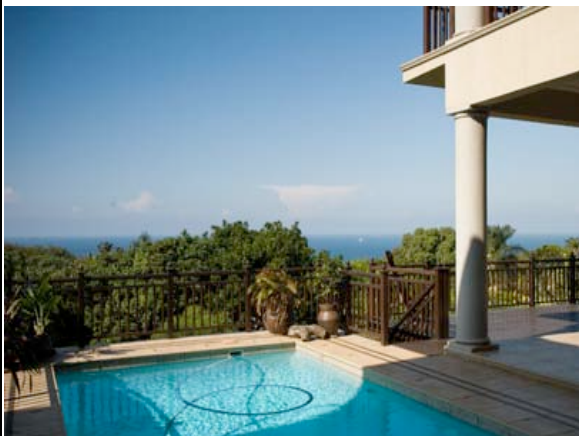
Pool mit Meerblick

Die Tega Tata Lodge liegt in einer ruhigen Wohngegend in Umhlanga. In nur wenigen Autominuten sind die Strände, diverse Restaurants und das berühmte Gateway Shopping Center erreicht. Von der Lodge au genießen Sie einen herrlichen Blick auf Umhlanga und das Meer-. Die 8 Zimmer verfügen über Bad/WC, Klimaanlage, Deckenventilatoren, Föhn, TV, W-Lan. Die Lodge bietet einen Pool und einen schönen Garten.