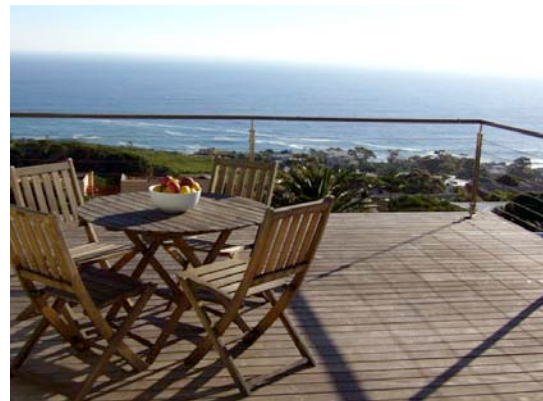
Exklusiv für SA Travel Kunden: Lobster House