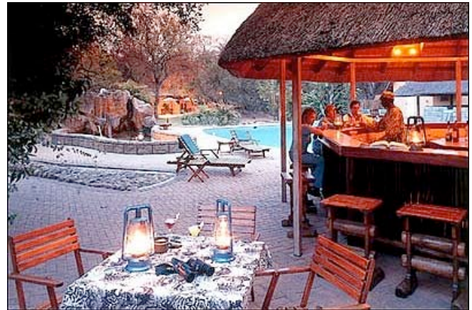
Shiduli Private Safari Lodge