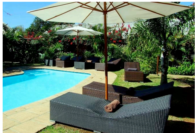
Garten und Pool