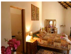
Chalet der Lodge

Die Übernachtungen finden in Chalets einer privaten Lodge in einem Big Five Wildreservat am Krüger Park statt. Seit vielen Jahren ist das Reservat nicht mehr durch Zäune vom Krüger Park abgetrennt, so dass sich die Tiere frei bewegen können. Alle Chalets haben ihr eigenes Bad/WC, eine Klimaanlage, einen Tee/Kaffeezubereiter sowie Moskitonetze. Zu den Annehmlichkeiten der Lodge gehören ein Pool, eine Bar, ein Aussichtsdeck auf ein Wasserloch, ein schöner subtropischer Garten und ein Boma (traditioneller Essensplatz am Lagerfeuer).