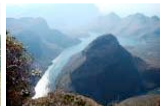
Blyde River Canyon