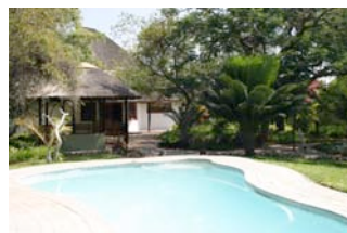
Pool und Garten der Lodge