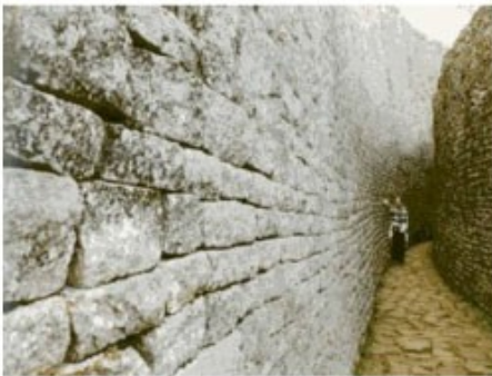
Mauer der Great Zimbabwe Ruins

2x Übernachtung mit Frühstück Great Zimbabwe Hotel (Standard Room)