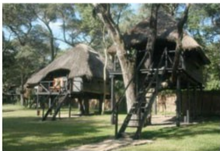
Chalets der Lodge

Der etwa 15000 qm große Nationalpark liegt in den Ausläufern der Kalahari und ist das bedeutendste Naturschutzgebiet Zimbabwes, in dem eine dichte Tierpopulation lebt. Über 20000 Elefanten, 17000 Büffel, 6000 Impalas, 5000 weitere Antilopen und Kudus, sowie 3000 Giraffen wurden zuletzt gezählt, aber auch Geparden, Leoparden, Löwen, Wasserböcke und andere Tiere des südlichen Afrikas können Sie hier finden. Das ganze Gebiet ist eine nahezu ebene Savanne, mit wenigen natürlichen Wasserlöchern und vor allem im Westen mit spärlicher Vegetation bedeckt. Die beste Zeit für gute Tierbeobachtungen ist die Trockenzeit im Winter von Mai bis Oktober.