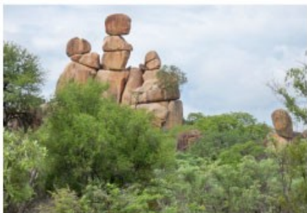
Gesteinsformation in den Matobo Hills

2x Übernachtung mit Frühstück Garda Lodge (Standard Room)