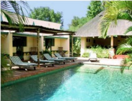
Pool der Lodge

Die Viktoriafälle im Norden an der Grenze zu Zambia sind mit Sicherheit das Highlight des Landes, wenn nicht sogar des ganzen afrikanischen Kontinents. Auf über einem Kilometer Länge stürzt der mächtige Zambezi River abrupt über 100m in die Tiefe in eine nur noch 50m breite Schlucht. Ein Naturwunder, welches seines Gleichen sucht. In der Regenzeit zwischen November und April fließen hier rund zehn Millionen Liter Wasser pro Sekunde über den Felsrand. Der entstehende Sprühnebel der Wasserfälle kann bis zu 400 Meter in die Höhe steigen und erzeugt in unmittelbarer Nähe einen üppigen Urwald, verdeckt aber auch ein wenig die Sicht. In der Trockenzeit fließt deutlich weniger Wasser, dafür fehlt aber auch meist der störende Nebel. Der touristische Ort Victoria Falls bietet darüber hinaus eine Vielzahl von Aktivitäten wie Sunset Cruises auf dem oberen Teil des Zambezi River, Kanufahrten, Wild Water Rafting, Bungee Jumping, Rundflüge über die Wasserfälle, Elephant Back Safaris und vieles mehr.