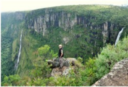
Mtarazi Wasserfall in den Eastern Highlands

3x Übernachtung mit Frühstück Musangano Lodge (Chalet)