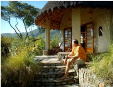
Chalet der Lodge

Die Eastern Highlands sind so etwas wie der Garten Eden Zimbabwes. Der östliche Teil des Landes an der Grenze zu Mosambik mit Mutare als Provinzhauptstadt besticht durch einmalige Berglandschaften, unzählige Wasserfälle und endlose Natur. Wandern, Fischen, Reiten und Mountainbiking sind nur einige wenige der hier möglichen Aktivitäten.