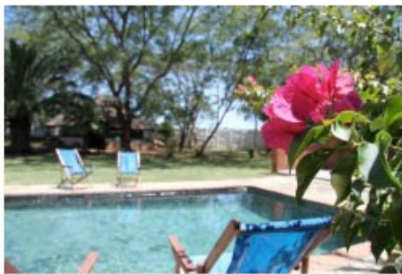
Pool der Lodge

Bulawayo ist die Stadt der breiten Strassen, der blühenden Bäume und vieler viktorianischer Kolonialbauten. In der Nähe des Bahnhofes können Sie im Eisenbahnmuseum einige historische Dampflokotivten besichtigen. Im Museum steht auch ein Salonwagen von Cecil Rhodes, dem Stadtgründer. Etwas westlich von Bulawayo stehen die Khami Ruins. Die Reste einer Stadt aus dem 15. Jahrhundert, gegründet vom mächtigen Stamm der Rosvi, sind ein UNESCO-Weltkulturerbe. Südlich von Bulawayo liegt der wunderschöne Matobo Nationalpark, der älteste Wildschutzpark des Landes. Er beheimatet unter anderem Antilopen, Nashörner, Großkatzen, Giraffen und Zebras. Entlang der wuchtigen Felsen der Matobo Hills gibt es in einigen Höhlen gut erhaltene Felszeichnungen der San, der Ureinwohner des südlichen Afrikas, zu sehen.