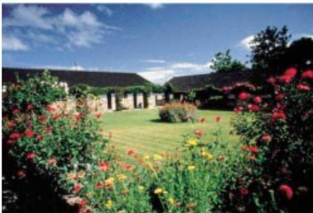
Great Zimbabwe Hotel

Die geschichtsträchtigen Ruinen von Great Zimbabwe liegen ein paar Kilometer südlich von Masvingo. Zimbabwe bedeutet "Steinhaus" und Teile dieser ehemals wunderbaren Stadt aus Stein sind noch heute zu sehen. Auch wenn wahrscheinlich nur noch ein Bruchteil der ursprünglichen Stadt erhalten ist, lassen die verbliebenen Mauern und Türme ehemaligen Reichtum und Macht dieses bis heute unbekanntes Volkes nur erahnen. Die Stadt wurde wahrscheinlich im Jahr 1000 erbaut und hatte ihre Blüte im 12. und 13. Jahrhundert. Seit 1986 ist sie ein Weltkulturerbe der UNESCO.