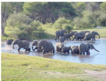
Elefanten im Hwange Nationalpark

2x Übernachtung mit Vollpension und 4 Aktivitäten Sikumi Tree Lodge (Treehouse Chalet)