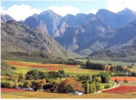
Weingebiete des Western Capes

2x Übernachtung mit Frühstück Knorhoek Guesthouse (Patio Room)