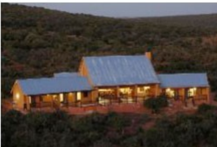
Lodge am Addo Elephant Park

Sie fahren weiter in Richtung Südwesten. Ihr Ziel ist der malariafreie Addo Elephant Park im Eastern Cape, berühmt für seine großen Elefantenherden, die dem Park seinen Namen gegeben haben. Aber der Addo hat noch viel mehr zu bieten: Durch Landzukaufe erstreckt er sich mittlerweile bis zur Küste und rühmt sich daher als einziger „Big 7“-Nationalpark, der neben Löwen, Büffeln, Elefanten, Nashörnern und Leoparden auch Wal- und Haisichtungen bietet.