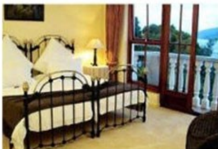
Zimmerbeispiel Bradach Manor

Sie setzen Ihre Reise fort bis Sie die so genannte Garden Route erreichen. Sie fahren weiter ins kleine Örtchen Knysna mit seiner bekannten Lagune, die nur durch eine kleine Meerenge mit dem Indischen Ozean verbunden ist. Eine Sunset Cruise auf der Lagune ist ein echtes Highlight. Knysna ist das „Oyster Capital“, die Austern-Hauptstadt, Südafrikas. Die dichten Wälder laden zum Wandern ein, die nahe gelegene Buffalo Bay zum Baden. Aber auch der Ort Knysna lädt mit seinen Cafes, Shops und Boutiquen zum Schlendern ein.