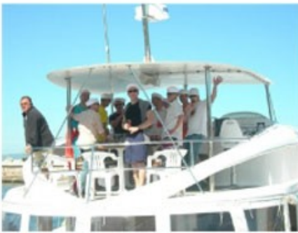
Walbeobachtung mit dem Katamaran

Boat-based Whale Whatching - optional gegen Aufpreis buchbar -