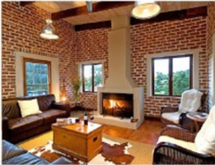
Kaminlounge des Gästehauses

Der Tsitsikamma Nationalpark ist ideal zum Wandern oder Relaxen. Die Wanderwege bieten immer wieder eine traumhafte Aussicht auf die dichten Wälder und das unendliche Meer. Im Storms River Restcamp im östlichen Teil des Parks können Sie kleine Bootstouren auf dem gleichnamigen Fluss unternehmen. Ganz in der Nähe ist auch die berühmte Bloukrans-Brücke, die den höchsten Bungee-Jump der Welt bietet. Auch der westliche Teil, das Natures Valley, bietet beste Bade- und Wandermöglichkeiten. Wale und Delfine sind keine seltenen Gäste.