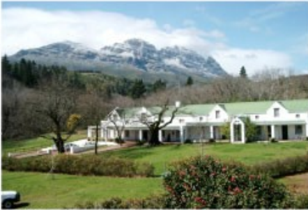
Gästehaus in den Weinbergen

Sie fahren in die berühmten Weingebiete des Western Capes. Unzählige Weingüter reihen sich aneinander, der ein oder anderen Weinprobe steht also nichts mehr im Wege. Sie fahren weiter bis ins Herz der südafrikanischen Weinproduktion nach Stellenbosch. Die zweitälteste Stadt des Landes hat einen wunderschönen historischen Stadtkern mit vielen Gebäuden im kapholländischen Baustil. Cafes, Restaurants und Shops laden zum Bummeln und Verweilen ein.