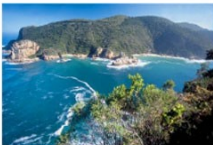
Entlang der Garden Route

2x Übernachtung mit Frühstück Bradach Manor (Lagoon Facing Room) - optional gegen Aufpreis buchbar -