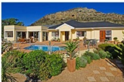
Gästehäuser in Hermanus

Sie fahren bis in die „Walhauptstadt“ Südafrikas, nach Hermanus. Hier haben Sie beste Möglichkeiten, zwischen Juni und November Wale von der Küste aus zu beobachten. Sie können natürlich auch eine Bootsfahrt auf das offene Meer hinaus machen, um den größten Säugetieren der Erde noch näher zu kommen. Aber auch außerhalb der Walsaison bietet die Umgebung tolle Strände und eine einmalige Natur.