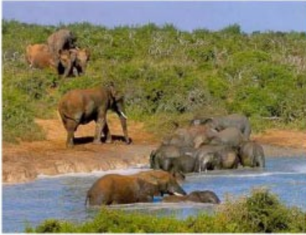
Elefanten gaben dem Addo seinen Namen

2x Übernachtung mit Halbpension und 4 Aktivitäten Kuzuko Lodge (Luxury Chalet) - optional gegen Aufpreis buchbar -