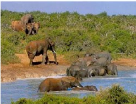
Elefanten gaben dem Addo seinen Namen

2x Übernachtung mit Frühstück und 1 Aktivitäten Bushveld Country Lodge (Two Nights Package)