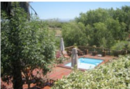
Pool und Garten

Sie fahren durch das trockene Hinterland bis zur „Straußen-Hauptstadt“ des Landes Oudtshoorn, dem Zentrum der Kleinen Karoo. Ein Stopp bei einer Straußenfarm darf nicht fehlen. Absolut sehenswert sind die Cango Caves, eine riesige Tropfsteinhöhlenlandschaft.