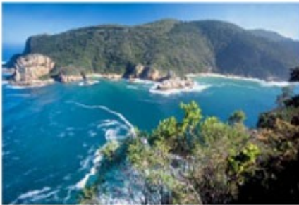
Entlang der Garden Route

2x Übernachtung mit Frühstück Boardwalk Lodge (Luxury Room)