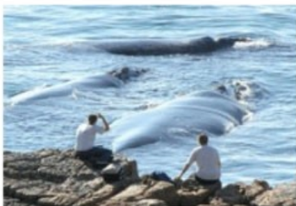
Wale an der Küste bei Hermanus

1x Übernachtung mit Frühstück Anha Casa (Standard Room)