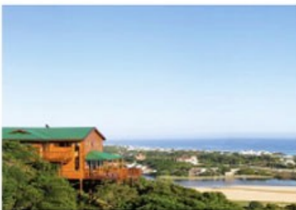
Chalet der Boardwalk Lodge

Die kommenden Nächte wohnen Sie in der schönen Boardwalk Lodge im paradiesischen Wilderness mit seinem schönen Nationalpark zwischen Indischem Ozean und den Outeniqua Mountains. (15 Zimmer: Bad /WC, TV, Minibar, Veranda oder Balkon. Lodge: Lounge, sicheres Parken, Pool)