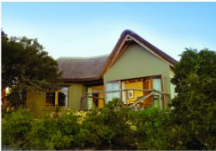
Chalet der Lodge

Sie übernachten in der luxuriösen Kuzuko Lodge mitten im Addo Elephant Park in einem geräumigen Chalet. Pro Übernachtung nehmen Sie an zwei geführten Pirschfahrten im offenen Geländewagen teil. (24 Chalets: Bad/WC, Tee/Kaffeezubereiter, Klimaanlage, Minibar, Safe, Veranda, TV. Lodge: sicheres Parken, Pool, Restaurant, Bar, Lounge)