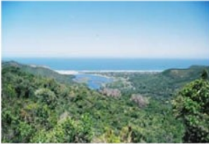
Natures Valley im Tsitsikamma Nationalpark

2x Übernachtung mit Frühstück At the Woods Guesthouse (Standard Room )