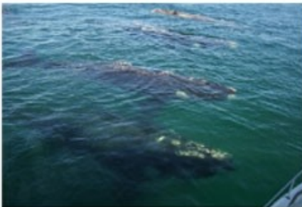
Wale zum Anfassen

Von Juni bis November haben Sie in der Walker Bay bei Hermanus beste Chancen, Gattwale und Humpbackwale zu beobachten. Mit dem Boot können Sie bis auf 50m an diese gigantischen Meeressäuger herankommen. Ein Erlebnis, das niemand verpassen sollte.