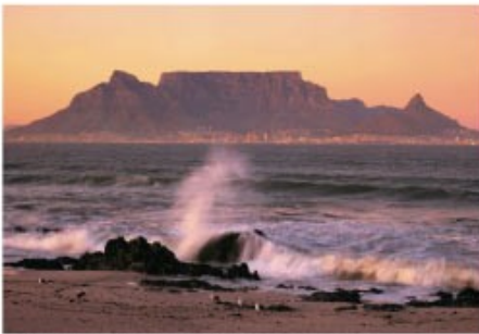
Table Mountain bei Sonnenuntergang

3x Übernachtung mit Frühstück Floreal House (Standard Room)