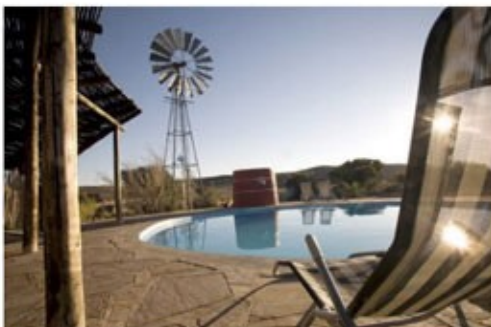
Pool des Canon Roadhouse

Südlich von Keetmanshoop befindet sich der berühmte Fish River Canyon. Dieser Canyon zählt, als zweitgrößter Canyon der Erde nach dem Grand Canyon in den USA, zu den Highlights einer Reise durch das südliche Afrika. Genießen Sie faszinierende Ausblicke über Schluchten und Felsformationen geschaffen in Millionen von Jahren durch den Fish River. Besuchen Sie zudem die heißen Quellen von Ai-Ais und nehmen Sie an fakultativen Angeboten des Gondwana Canyon Parks teil.