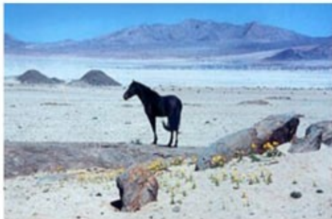
Wildpferde bei Aus

2x Übernachtung mit Frühstück Desert Horse Inn (Standard Room)