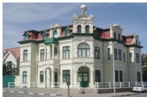
Das Hohenzollernhaus in Swakopmund

2x Übernachtung mit Frühstück Swakopmund Beach Lodge (Standard Room) - optional gegen Aufpreis buchbar -