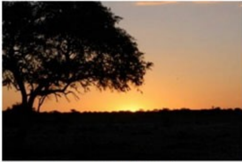
Sonnenuntergang in der Kalahari

2x Übernachtung mit Frühstück Auob Lodge (Standard Room )