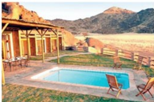
Drifters Desert Lodge

Noch vor Sonnenaufgang sollten Sie sich auf den Weg machen um den Sonnenaufgang im Sossusvlei zu erleben- das Farbenspiel ist unbeschreiblich. Bestaunen Sie die Dünenlandschaften des Namib Naukluft Parks. Hier im berühmten Sossusvlei gibt es Sanddünen die teilweise eine Höhe von bis zu 300 Metern erreichen und damit zu den höchsten der Welt gehören. Eine der berühmtesten darunter ist die Düne Sieben.