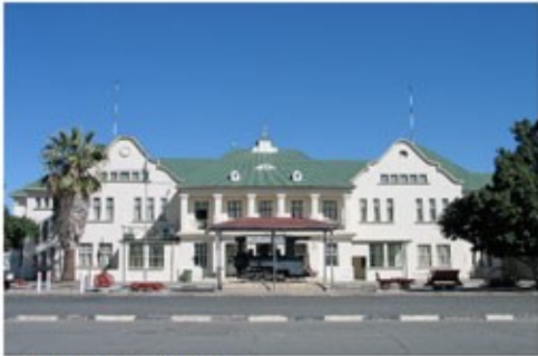
Bahnhof in Windhoek

Sie bekommen auch eine 24-Stunden-Notfalltelefonnummer, unter der Ihnen unsere örtliche deutschsprechende Reiseleitung rund um die Uhr zur Verfügung steht. Der restliche Tag steht Ihnen zur freien Verfügung um die namibische Hauptstadt Windhoek zu erkunden.