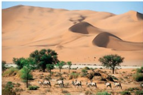
Oryx Antilopen im Sossusvlei

2x Übernachtung mit Vollpension und 4 Aktivitäten Drifters Desert Lodge (Standard Room) - optional gegen Aufpreis buchbar -