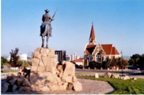
Reiter und Christuskirche in Windhoek

Am internationalen Flughafen übernehmen Sie Ihren Mietwagen. Unsere örtliche deutschsprechende Reiseleitung wird sich mit Ihnen in Ihrem Hotel in Windhoek treffen, um mit Ihnen gemeinsam die Tour zu besprechen und Ihnen wertvolle aktuelle Reisetipps zu geben.