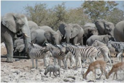
An einem Wasserloch im Etosha Nationalpark

2x Übernachtung mit Halbpension Okaukuejo Rest Camp (Waterhole Chalet) - optional gegen Aufpreis buchbar -