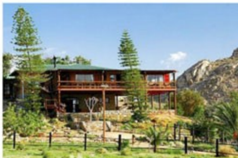
Desert Horse Inn

Die Gegend um das Örtchen Aus wird von endlos weiten Ebenen bestimmt. Hier findet man die legendären Wildpferde der Namib, die man bei geführten Wanderungen zu diversen Attraktionen der Gegend entdecken kann. Einen Besuch wert ist auch das Städtchen Lüderitz sowie die „Geisterstadt Kolmanskupe“. Dort erleben Sie hautnah, wie man zu Zeiten des Diamantenfiebers lebte.