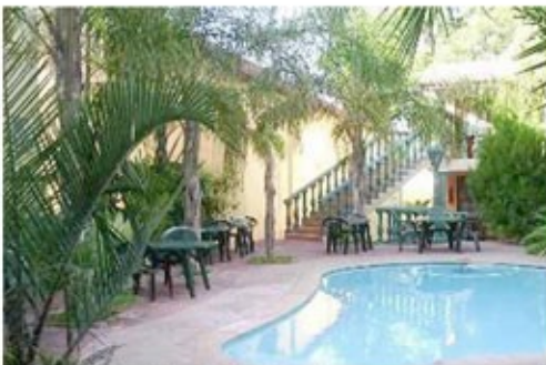
Pool des Makalani Hotels

Sie wohnen im Makalani Hotel im Zentrum von Tsumeb, das Finanz- und Einkaufszentrum ist von hier aus bequem zu Fuß erreichbar. (28 Zimmer: Bad/WC, Klimaanlage, Telefon, TV. Hotel: Restaurant, Bar, Biergarten, Pool, Casino, sicheres Parken)