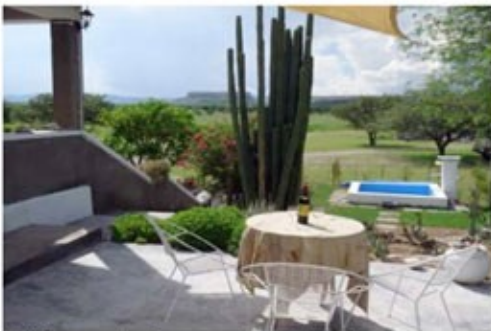
Blick von der Terrasse der Gästefarm

Khorixas ist Zentrum des Damaralandes, das sich zwischen Erongo und der Etosha Pflanze erstreckt. Rund 90 Kilometer westlich von Khorixas liegt Twyfelfontein. Die UNESCO hat Twyfelfontein im Jahr 2007 auf die Liste der Weltkulturerben gesetzt mit der Begründung, dass sich hier die größte Ansammlung von Felszeichnungen und -gravuren in Afrika befindet. Die Gravuren befinden sich auf einer Reihe von glatten Felsplatten und stellen zumeist Tiere oder Tierfährten dar. Über das Alter ist man sich nicht einig. Schätzungen bewegen sich zwischen 1000 und 10000 Jahren. Ebenfalls zu besichtigen sind die sogenannten Orgelpfeifen und der verbrannte Berg sowie der versteinerte Wald.