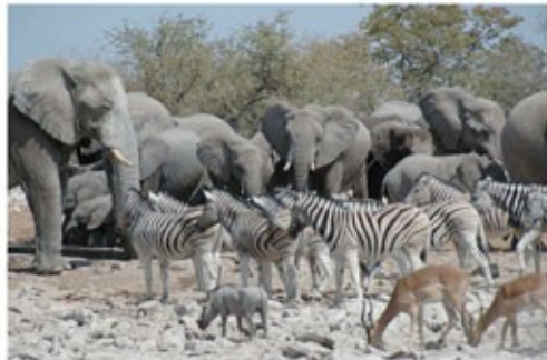
An einem Wasserloch im Etosha Nationalpark

2x Übernachtung mit Frühstück Toshari Lodge (Standard Room)