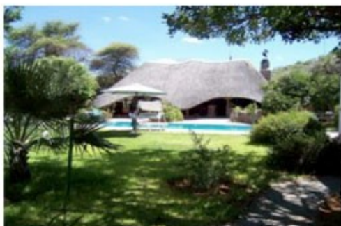
Weavers Rock Gästefarm

An der B1, westlich des Waterberg Massivs liegt Otjiwarongo. In dieser Region befinden sich einige der namhaftesten Wildfarmen und Organisationen, die sich für den Schutz der afrikanischen Wildtiere einsetzen z.B. der Cheetah Conservation Fund (CCF), der Rare and Endangered Species Trust (REST) oder die Farm Okoniima. Entspannen Sie auf der Gästefarm oder machen Sie einen Ausflug zum Waterberg N.P. wo Sie fakultativ an geführten Pirschfahrten teilnehmen können.