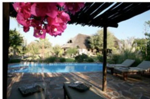
Immanuel Wilderness Lodge

Willkommen in der Hauptstadt. Windhoek ist Hauptstadt sowie wirtschaftliches und politisches Zentrum von Namibia. Die Stadt liegt im Windhoeker Becken, dem annähernd geographischen Mittelpunkt des Landes, eingefasst zwischen Erosbergen im Osten, Ausabergen im Süden und Khomashochland im Westen und Norden.