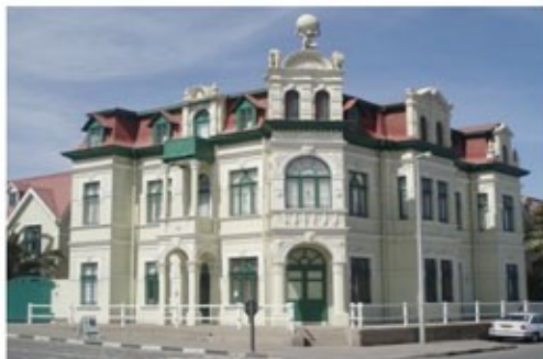
Das Hohenzollernhaus in Swakopmund

2x Übernachtung mit Frühstück Veronika B&B (Rhino Room)