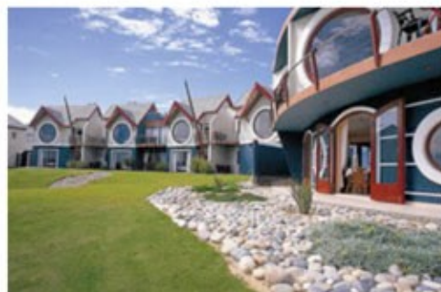
Swakopmund Beach Lodge

Ihr Ziel ist Swakopmund, nördlich der Mündung des Flusses Swakop. Der Ort war einst das Tor zu Deutsch-Südwestafrika. Die gesamte Versorgung der Kolonie wurde über den kleinen Ort abgewickelt. Das Stadtbild wird durch zahlreiche Kolonialbauten geprägt, wie zum Beispiel dem Bahnhof im wilhelminischen Stil. Einen Besuch wert ist von hier aus auch Walvis Bay, das damals fest in britischer Hand war. Nehmen Sie von dort aus an fakultativen Bootsfahrten oder anderen Aktivitäten teil.