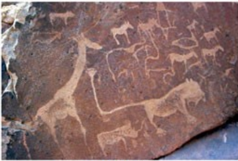
Felsgravuren von Twyfelfontein

2x Übernachtung mit Frühstück Farm Omboro Ost (Standard Room)