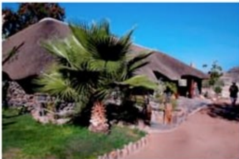
Weltevrede Guest Farm

Weiter geht Ihre Reise entlang des wunderschönen Namibrandes. Am kommenden Tag heißt es früh Aufstehen. Noch bevor die Sonne aufgeht sollten Sie sich auf den Weg machen, um den Sonnenaufgang im Sossusvlei zu erleben- das Farbenspiel ist unbeschreiblich. Bestaunen Sie die Dünenlandschaften des Namib Naukluft Parks. Hier im berühmten Sossusvlei gibt es Sanddünen die teilweise eine Höhe von bis zu 300 Metern erreichen und damit zu den höchsten der Welt gehören. Eine der berühmtesten darunter ist die Düne Sieben