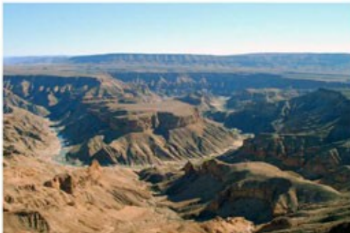
Fish River Canyon

2x Übernachtung mit Frühstück Canon Roadhouse (Standard Room)