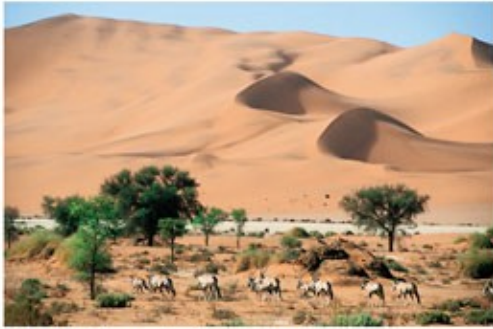
Oryx Antilopen im Soussusvlei

2x Übernachtung mit Halbpension Weltevrede Guest Farm (Standard Room)