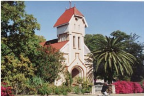
Kirche in Tsumeb

1x Übernachtung mit Frühstück Makalani Hotel (Standard Room)