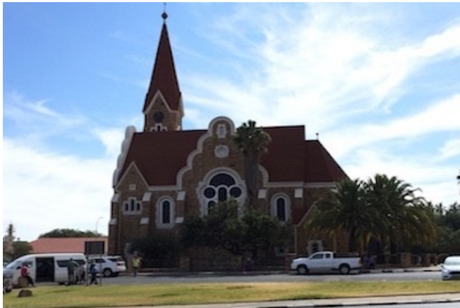
Christuskirche in Windhoek

Das Casa Piccolo Gästehaus liegt im Herzen Klein Windhoeks. Von der Pension sind es nur wenige Fahrminuten in die Innenstadt. Genießen Sie nach einem anstrengenden Flug oder einem langen Tag ein kühles Getränk im Garten des Innenhofs oder relaxen Sie am Pool. Die 16 Zimmer sind einfach eingerichtet. Sie verfügen über Dusche/WC, Klimaanlage, Minibar und TV.