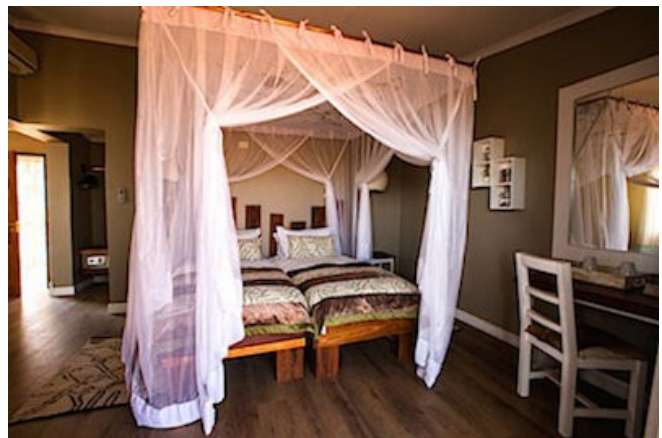
Kalahari Anib Lodge