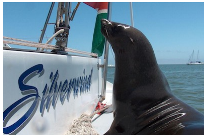
Seehund während der Catamaran Tour