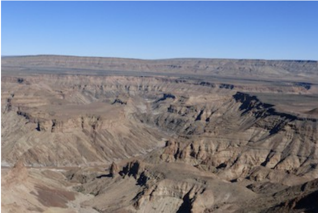
Fish River Canyon

Das Canyon Roadhouse war ursprünglich eine gewöhnliche Tankstelle, bevor es zu einem Gästehaus und der ideale Ort zum „Auftanken“ wurde. Auch wenn das Benzin heute nicht mehr das Wichtigste ist, getankt wird hier immer noch: Freude, Faszination, Erholung, Erinnerungen und ein atemberaubendes Abenteuer. Im Roadhouse, das längst Kultstatus erreicht hat, dreht sich alles um alte Autos. Die 22 thematisch eingerichteten Zimmer sind mit Dusche/WC, Klimaanlage, Heizung, Safe, Tee- und Kaffeezubereiter und Veranda ausgestattet, außerdem verfügt das Gästehaus über ein Restaurant, eine Bar und einen Pool.