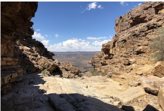
Fish River Canyon