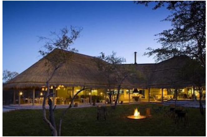
Mushara Bush Camp