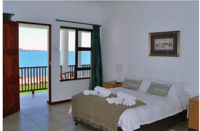
Zimmerbeispiel von Kairos Cottage