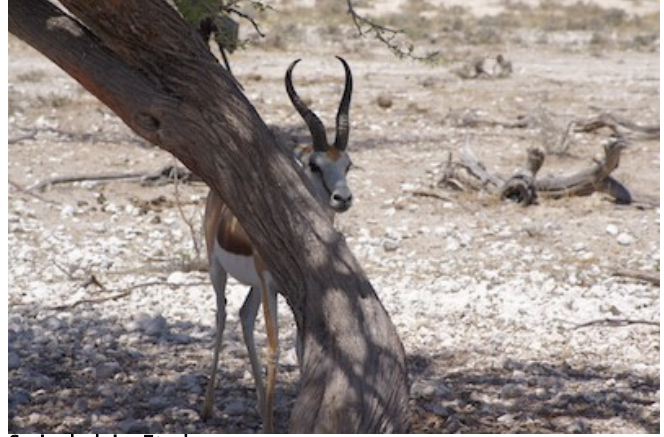
Springbok im Etosha