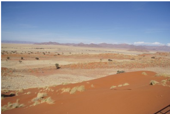
Dünen bei Sesriem

Sie übernachten im Desert Camp, das ca. 5 Kilometer vom Eingang zum Sossusvlei liegt. Namibias beeindruckende Dünenwelt erreichen Sie innerhalb von wenigen Minuten. Von Ihrem Safari Zelt und vom Pool aus genießen Sie einen Panoramablick in die Bergwelt. Die 20 Zelte bieten Ihnen Bad/WC, Terrasse, Grill, Kitchenette und einen Kühlschrank. Die Mahlzeiten werden in der 5 Kilometer entfernten Sossusvlei Lodge eingenommen. Alternativ bestellen wir eine Grillbox für Sie, die von der Sossusvlei Lodge geliefert wird. Getränke bekommen Sie in der Bar in Ihrem Camp.