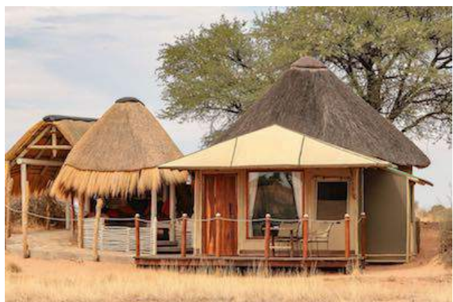
Kalahari Red Dunes Lodge