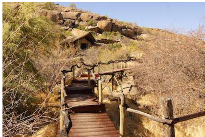
Erongo Wilderness Lodge