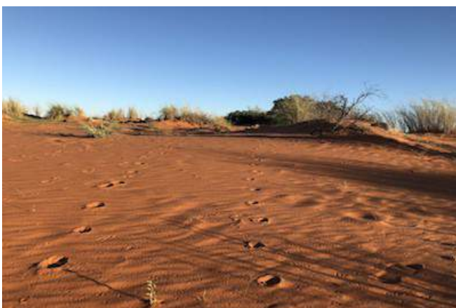
Düne in der Kalahari

SO WOHNEN SIE: Übernachtung mit Halbpension - Kalahari Red Dunes Lodge (Standard Room) Die Lodge liegt in der Nähe von Kalkrand in einem 4000 Hektar großen privaten Wildreservat. Rote Kalahari Dünen und Kameldornbaum-Savanne prägen die Landschaft. Man erreicht das Haupthaus nur über einen 120 Meter langen Holzsteg. Sportbegeisterte können die speziell angelegte Joggingstrecke nutzen oder Sie entspannen auf der Sonnenterrasse mit Pool und Blick auf die Wasserstelle. Die Lodge verfügt über ein Restaurant und die 12 Zelt-Chalets sind mit Bad oder Dusche/WC, Außendusche, sowie einem Panoramafenster zur Wasserstelle ausgestattet.