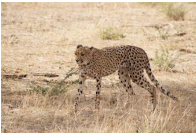
Gepard in Okonjima

Das Plains Camp ist Teil des Wildschutzgebiets Okonjima. Die alte Scheune der ehemaligen Rinderfarm wurde zum Hauptgebäude umgebaut, welches im Design die Geschichte der Farm widerspiegelt. Die 24 Zimmer bieten neben Bad/WC auch eine Klimaanlage, Kaffee- und Teezubereiter, einen Safe, sowie eine Veranda. Mit etwas Glück können Sie vom gemütlichen Open-Air Loungebereich Tiere an nahe gelegenen Wasserloch beobachten. Des Weiteren befinden sich draußen eine Boma und ein Pool, im Hauptgebäude finden Sie ein Restaurant und die Bar.