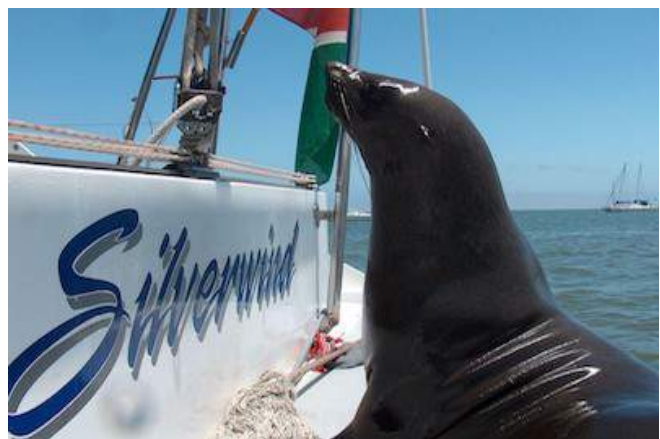
Seehund während der Catamaran Tour