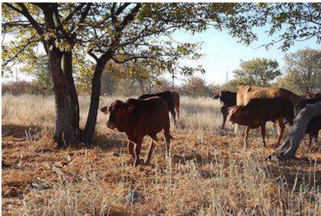
Rinder auf der Vreugde Guestfarm

Auf der kleinen und familienfreundlichen Guestfarm erleben Sie authentisches Farmleben, geselligen Familienanschluss, köstliche Mahlzeiten aus der regionalen Küche, etwa 30 Minuten vom Etosha Nationalpark entfernt. Relaxen Sie im großen Garten oder am Pool und genießen Sie lauschige Abende an der Grill- und Feuerstelle. Die 7 einladenden Zimmer sind mit Dusche/WC und Terrasse ausgestattet. Lassen Sie sich vom persönlichen und warmherzigen Service der Eigentümer verwöhnen.