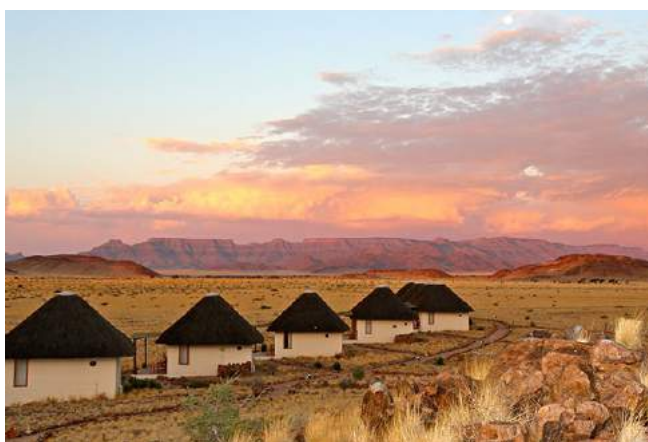
Desert Homestead Lodge