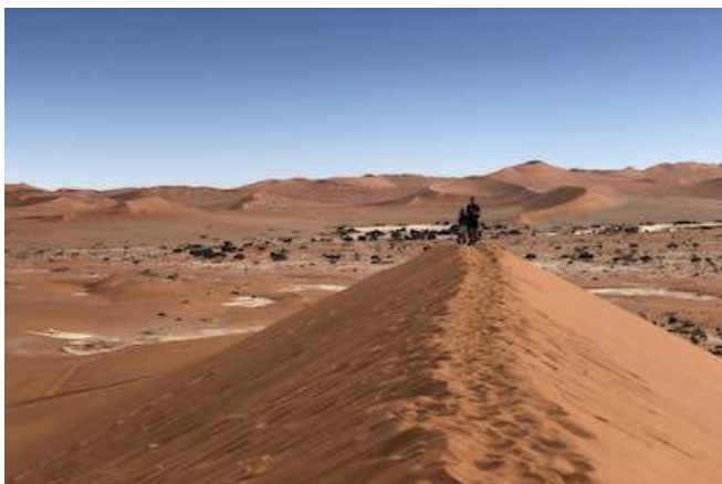
Dünen im Sossusvlei