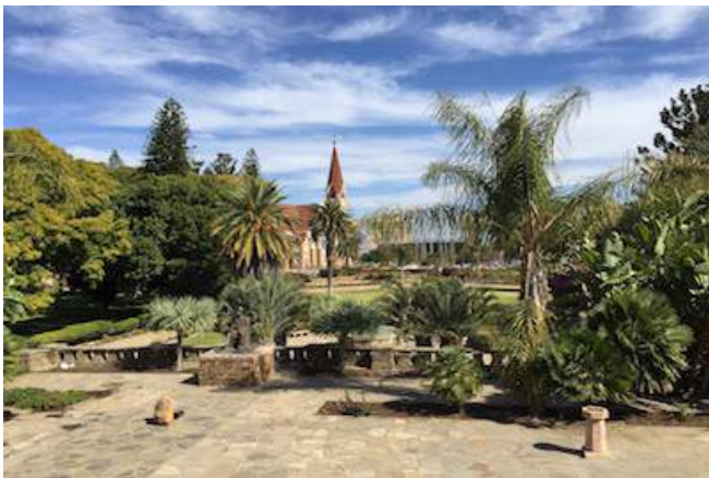
Parlimant Garden und Christuskirche

SO WOHNEN SIE: Übernachtung mit Frühstück - Villa Violet (Standard Room), Abendessen im Restaurant Villa Violet Bed & Breakfast liegt mitten in der schönsten Gegend von Klein Windhoek und bietet Ihnen eine frische, moderne und neue Art der Unterbringung. Die 5 Zimmer sind ausgestattet mit einem Bad/WC, Klimaanlage/Heizung, TV und einem Tresor. Das Gästehaus bietet einen Pool, Garten, Lounge, Bücherei, Kaffee- und Teestation und Internetmöglichkeiten.