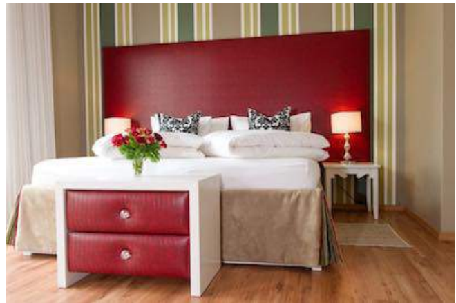
Zimmerbeispiel im Namib Guesthouse