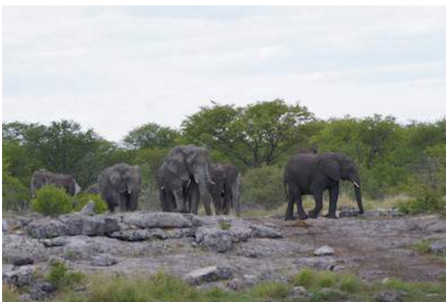
Elefanten im Etosha Nationalpark

Übernachtung mit Halbpension - Vreugde Guestfarm (Standard Room)