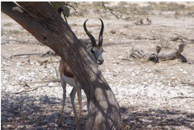
Springbok im Etosha Nationalpark

Die Mushara Lodge ist nur wenige Kilometer vom Lindequist Gate des Etosha Nationalpark entfernt. Die elegante Lodge mit ihrer liebevoll gestalteten Inneneinrichtung ist eine vielschichtige Mischung aus traditioneller afrikanischer Kunst und zeitgenössischen Kunstwerken. Die Lodge hat ein hauseigenes Restaurant und bietet Ihnen tolle Weine aus dem eigenen Weinkeller. Während Ihrer freien Zeit steht Ihnen eine Bar, ein Pool und die Lounge mit einer Leseecke zur Verfügung. Andenken an Ihre Reise finden Sie im Souvenirshop. Die 10 Bungalows haben ein Bad mit Dusche und WC, eine Klimaanlage und ein Moskitonetz. Des Weiteren sind die Bungalows mit einer Minibar, einem Tresorfach und Tee- und Kaffeezubereiter ausgestattet.