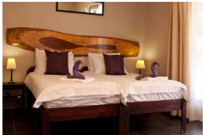
Zimmerbeispiel Villa Violet