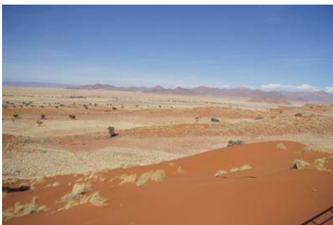
Dünen bei Sesriem

Die Desert Homestead Lodge befindet sich ca. 30 Kilometer südöstlich vom Eingang zum Sossusvlei entfernt. Sie liegt inmitten eines 7.000 Hektar großen, privaten Naturschutzgebiets, malerisch am Fuße eines Berges. Von hier aus genießen Sie einen eindrucksvollen Panoramarundblick. Fühlen Sie sich wie zu Hause und erleben Sie die ungezwungene natürliche Gastfreundschaft. Es gibt 26 Chalets die mit einem eigenen Bad/WC ausgestattet sind. Die Zimmer verfügen ebenfalls über ein Moskitonetz, eine Klimaanlage (mit Solarstrom, eingeschränkt nutzbar), eine Terrasse und einen Ventilator. Ihre Speisen genießen Sie im hauseigenen Restaurant, gönnen Sie sich einen kühlen Drink an der Bar, oder entspannen Sie am Pool. Von der Terrasse mit dem Aussichtsdeck haben Sie einen wundervollen Blick in die Natur.