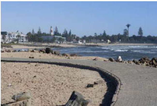
Küste von Swakopmund

SO WOHNEN SIE: Übernachtung mit Frühstück - Namib Guesthouse (Luxury Room), Abendessen im Restaurant Mit viel Liebe zum Detail und Sorgfalt ist das Namib Gästehaus eingerichtet. Überzeugen Sie sich von der familiären Gastfreundschaft gepaart mit dem unverwechselbaren Ambiente und einer perfekten Lage. Die gemütlichen und großzügigen Zimmer sind alle mit Bad/WC, TV, Kaffee- und Teezubereiter und einem Safe ausgestattet. Die warmen Farben laden zum Wohlfühlen ein.