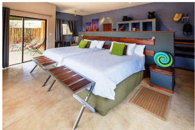
Zimmerbeispiel Okonjima Plains Camp

TAG 13 AUF WIEDERSEHEN NAMIBIA etwa 270 km Nach dem Frühstück haben Sie erneut die Möglichkeit an einer Pirschfahrt oder an einer Walking Safari teilzunehmen. Begeben Sie sich auf die Suche nach Wildkatzen, wie zum Beispiel Leoparden. Nach der Aktivität kehren Sie via Okahandja zurück zur Landeshauptstadt Windhoek. Wenn es die Zeit erlaubt besuchen Sie unterwegs in Okahandja den Holzschneidermarkt. Pünktlich zu Ihrem Rückflug werden Sie zum Internationalen Flughafen gebracht. Nun heißt es Abschied nehmen!