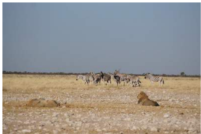
Löwen im Park