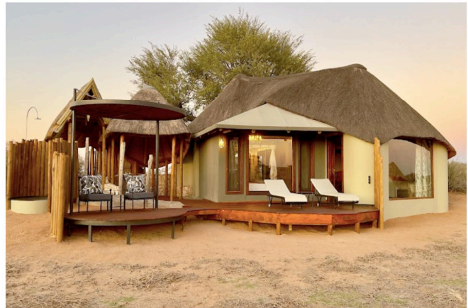
Chalet der Kalahari Red Dunes Lodge