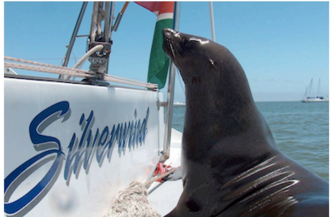
Seehund während der Tour