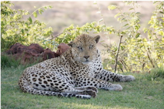
Leopard bei Okonjima

Das luxuriöse Okonjima Bush Camp liegt am Rande des Wildschutzgebiets, etwa 3 km vom Main Camp entfernt. Es ist ganz in Erdtönen gehalten und bietet eine Mischung aus Luxus und afrikanischem Charakter. Die Chalets und Safari-Zelte garantieren optimale Privatsphäre, denn sie liegen mindestens 80 Meter auseinander. Für einen 180° Blick können die Zeltwände aufgerollt werden. Die 12 Chalets und Safari-Zelte haben ein Bad/WC, ein Moskitonetz, Safe, Minibar, Tee- und Kaffeezubereiter und eine Terrasse. Das Camp hat ein Restaurant, Lounge mit Kamin, einen Pool und einen Souvenirshop.