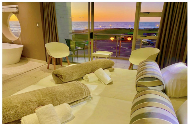
Zimmerbeispiel im At the Sea Guesthouse