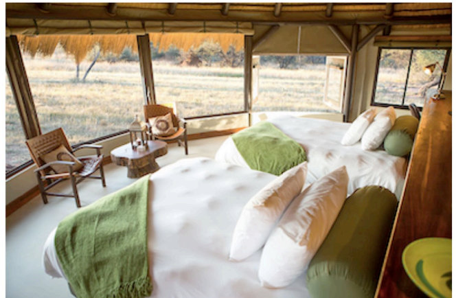
Zimmerbeispiel Okonjima Bush Camp

TAG 12 AUF WIEDERSEHEN NAMIBIA etwa 270 km