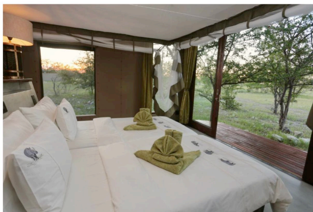
Zimmerbeispiel Etosha Oberland Lodge