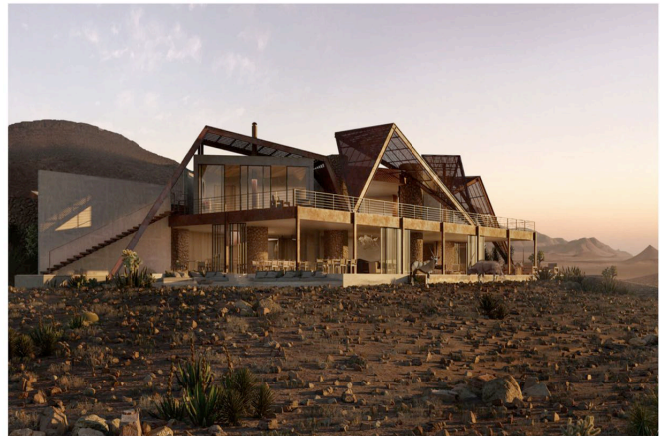
Hauptgebäude der Sossusvlei Desert Lodge