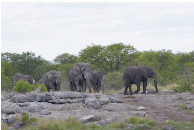
Elefanten im Etosha Nationalpark