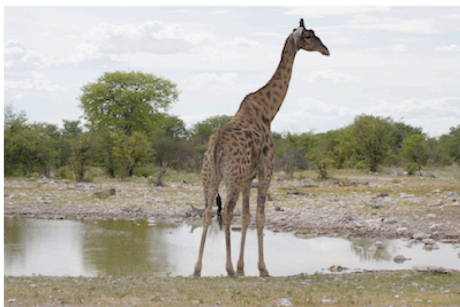
Giraffe am Wasserloch

Die großzügigen Doppel-Gästehäuser sind liebevoll in die Natur integriert. Alle Häuser sind so positioniert, dass Sie Ihre Nachbarn kaum wahrnehmen und versprechen somit viel Privatsphäre. Gegen Gebühr werden Pirschfahrten in den Etosha Nationalpark angeboten (gegen Gebühren englischsprachig und mit weiteren Personen). Die 15 Zimmer verfügen über Bad/Dusche, Außendusche, Klimaanlage, Minibar, Tee- und Kaffeezubereiter, Moskitonetze, Safe, Sonnenterrasse mit Ausblick. Die Unterkunft bietet ein Restaurant und eine Bar mit Terrasse, sowie eine Lounge, einen Pool und WiFi.