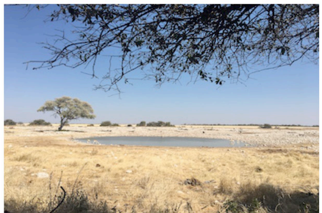
Wasserloch bei Onguma The Fort