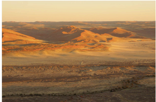
Dünen im Sossusvlei