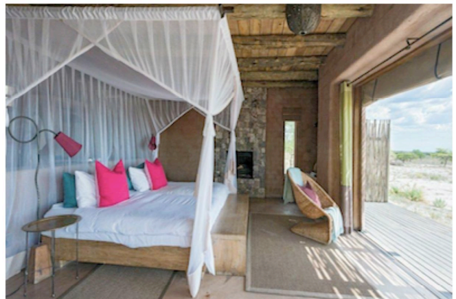
Onguma The Fort