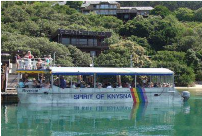
Bootsfahrt zum Featherbed Nature Reserve

Übernachtung mit Frühstück im Parkes Manor in Knysna