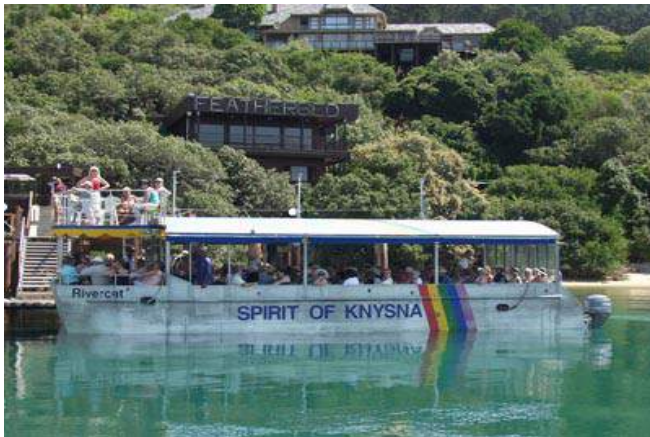
Bootsfahrt zum Featherbed Nature Reserve

Übernachtung mit Frühstück im Parkes Manor in Knysna