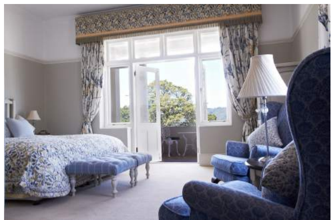
Classic Zimmer im Parkes Manor