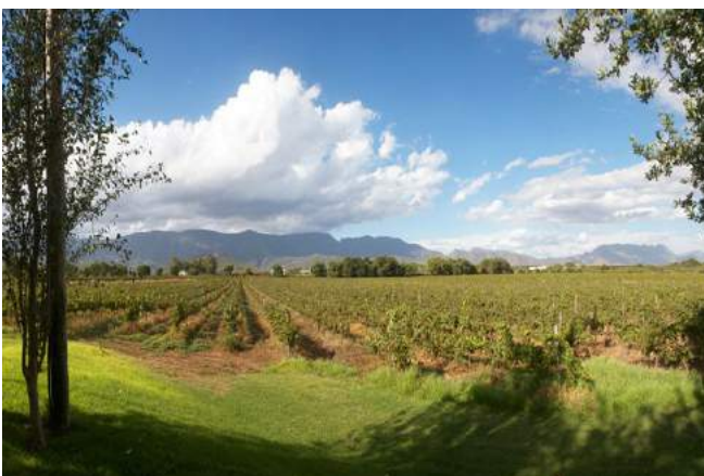
Robertson Wine Valley

Das Gubas de Hoek Gästehaus liegt mitten im Herzen von Robertson. Die 10 gemütlichen Zimmer verfügen über Bad/WC, TV, Telefon, Ventilator, Minibar, Tee/Kaffeezubereiter, Safe, Veranda oder Balkon. Das Gästehaus bietet: einen Pool, Restaurant, einen schönen Garten mit Grillmöglichkeit.