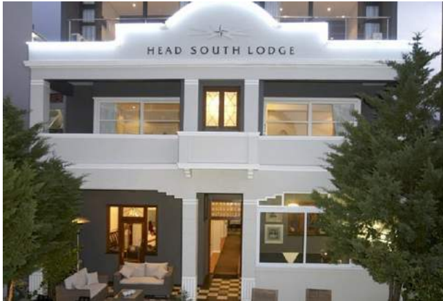
Head South Lodge

Sie übernachten in der Head South Lodge, einem kleinen inhabergeführten Boutique Hotel in Sea Point, nur wenige Gehminuten von der Strandpromenade und dem Green Point Park entfernt. Die V&A Waterfront erreichen Sie fußläufig in ca. 20 Minuten. Die insgesamt 22 Zimmer des Stadthotels mit modernem Raumkonzept sind ausgestattet mit offenem Bad, einem separaten WC, TV, Klimaanlage, Safe. Die Lodge verfügt über einen kleinen Plunge Pool, gratis WLAN, eine Honesty-Bar und 24-Stunden-Security.