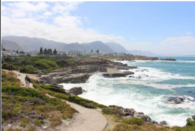
Hermanus Cliff Path

Übernachtung mit Frühstück im Hermanus Boutique Hotel