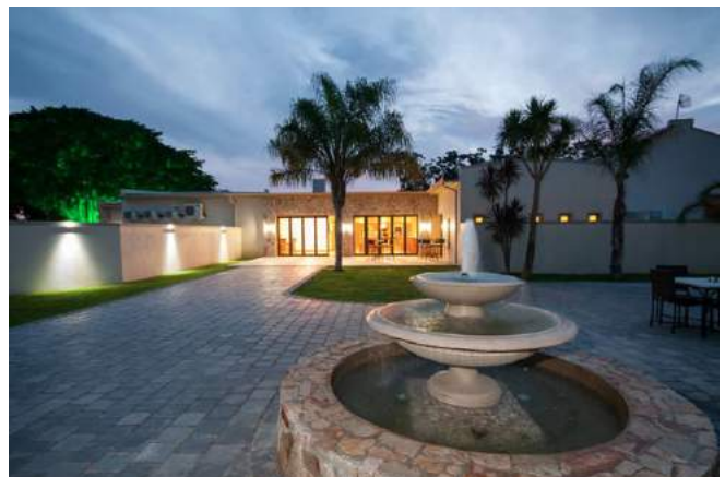
Africanos Country Estate