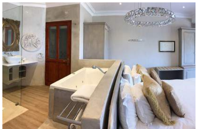
Zimmerbeispiel im Hermanus Boutique Guesthouse