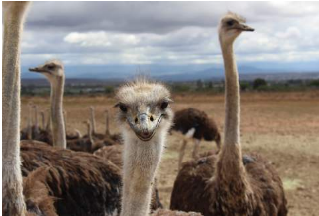
Auf der Straußenfarm

Sie übernachten im Mooiplaas Gästehaus, welches sich auf einer Straußenfarm befindet. Die 13 Zimmer verfügen über Bad/WC, Klimaanlage, Kühlschrank, Safe, TV, Telefon, Tee/Kaffe zubereiter, Föhn, W-Lan. Das Gästehaus bietet einen Pool und ein Restaurant.