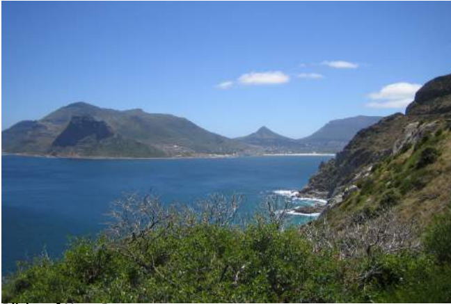
Blick auf Hout Bay

Übernachtung mit Frühstück in der Head South Lodge in Kapstadt