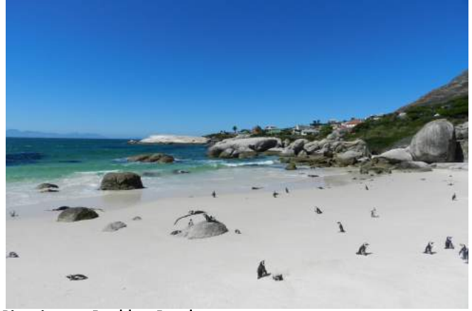
Pinguine am Boulders Beach