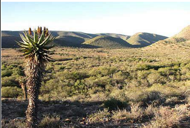
Unterwegs bei Steytlerville

Das schicke Africanos Country Estate liegt unweit des berühmten Addo Elephant Nationalparks. Die 12 Zimmer sind ausgestattet mit Bad/WC, Außendusche, TV, Telefon, Safe, Föhn, Kaffee- und Teestation, sowie einem Zimmerservice. Das Country Estate bietet einen Pool, eine Bar, eine Sushi-Bar und ein Restaurant.