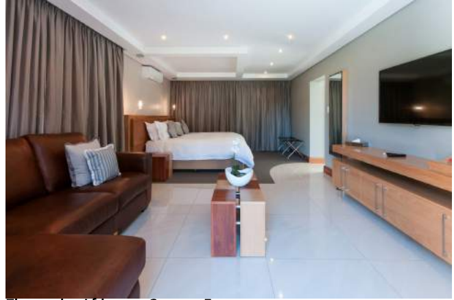
Zimmer im Africanos Country Estate