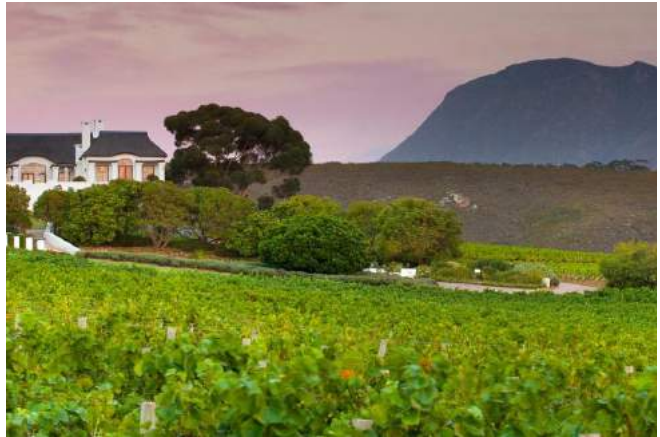
Weingut bei Hermanus