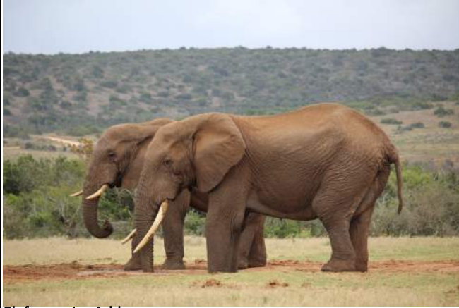
Elefanten im Addo

Übernachtung mit Halbpension im Africanos Country Estate bei Addo