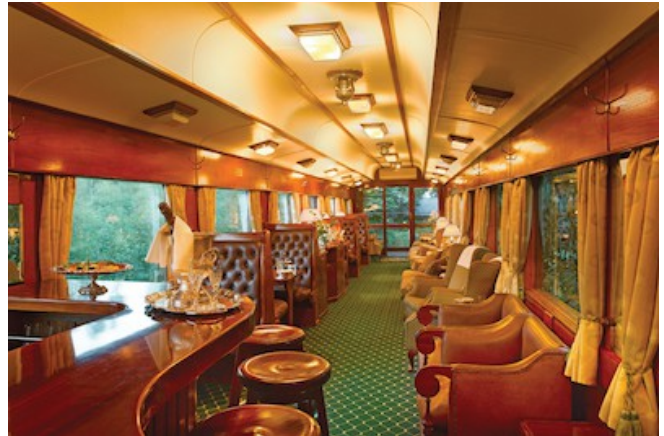
Die Bar des Rovos