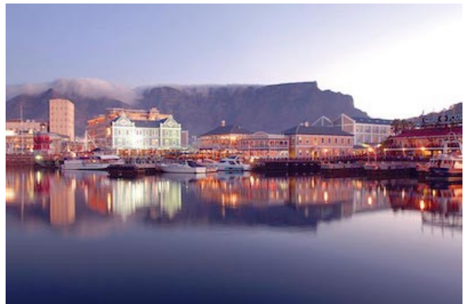
Kapstadt im Abendlicht