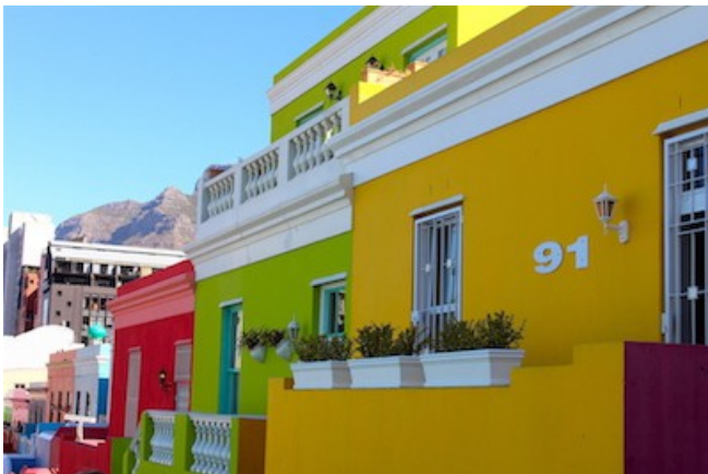
Das bunte Bo-Kaap Viertel

SO WOHNEN SIE: Übernachtung mit Frühstück - Zest Boutique Hotel (Superior Room) in Kapstadt