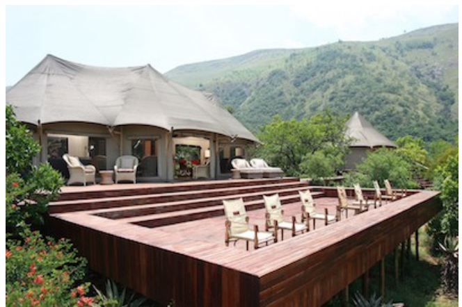
Das Komati Tented Camp