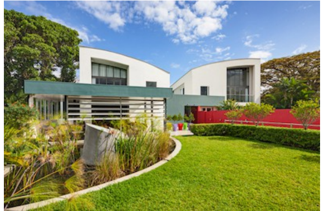
Das Serene Estate