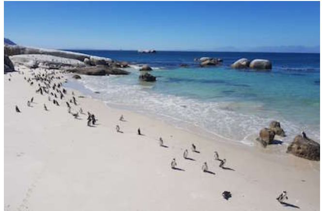
Pinguine am Boulders Beach