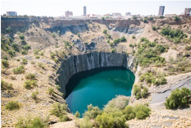
Das Big Hole in Kimberley

SO WOHNEN SIE: Übernachtung mit Vollpension - Rovos Rail (Pullman Suite)