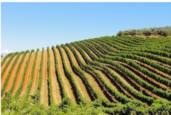
Idyllische Weinberge bei Stellenbosch

Sie übernachten im gehobenen Zest Boutique Hotel. Zwischen Green Point und De Waterkant gelegen bietet dieses bis ins kleinste Details durchdesignte Hotel luxuriöse Zimmer und eine persönliche Atmosphäre. Fußläufig erreichen Sie die V&A Waterfront. Die 14 Zimmer verfügen über ein offenes Bad mit separatem WC, eine Klimaanlage, einen Safe, einen Tee-/Kaffeezubereiter, ein TV sowie kostenloses WLAN. Die Classic Rooms befinden sich im ersten Geschoss. Die Deluxe Rooms sind geräumiger und haben zusätzlich einen Balkon. Die Superior Deluxe Rooms sind die größten Zimmer und bieten zusätzlich einen Balkon bzw. eine Terrasse. Darüber hinaus bietet das Hotel einen schönen Garten mit Pool und Sonnenliegen, eine Dachterrasse mit 360°-Ausblick, eine schöne Kaminlounge mit Bar und einen SPA-Bereich (gegen Gebühr).