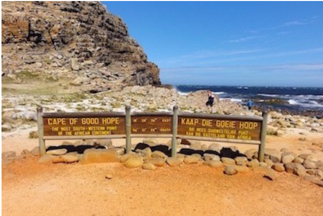
Am Kap der Guten Hoffnung

SO WOHNEN SIE: Übernachtung mit Frühstück - Zest Boutique Hotel (Superior Room) in Kapstadt