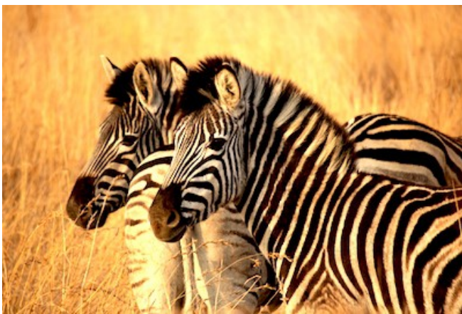
Zebras in der Abendsonne

Das private Nkomazi Wildreservat bietet eine exklusive Unterkunft, weit weg von den Touristenströmen. Die Komati Tented Lodge liegt an den Ufern des Komati Flusses mit wunderschönen Ausblicken in die Umgebung. Jede der 12 Zeltsuiten bietet mit eigenem, großen Sonnendeck und Plunge Pool viel Privatsphäre. Dazu kommen ein extragroßes King Size Bett, komfortable Heizung und Kühlung, Deckenventilator, Minibar, Safe und En-Suite Dusche mit einer Außenbadewanne.