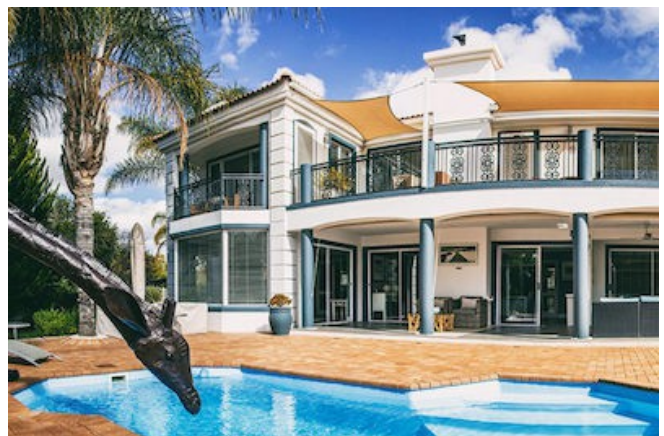
Das Pictures Guest House