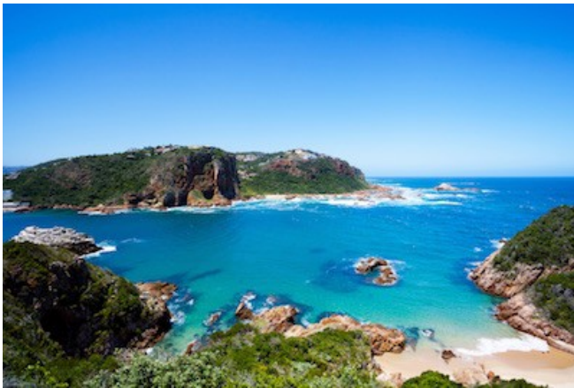
Die Lagune von Knysna

SO WOHNEN SIE: Übernachtung mit Frühstück - Villa Afrikana (Standard Suite) in Knysna