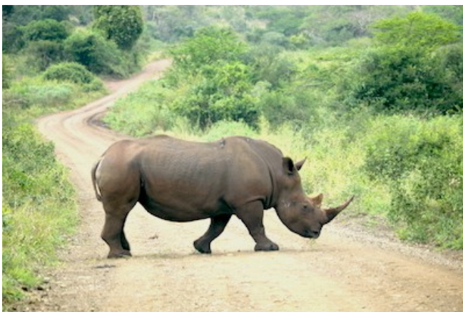
Nashorn im Hluhluwe Park

SO WOHNEN SIE: Übernachtung mit Frühstück - Serene Estate (Luxury Parkside Suite) in St. Lucia