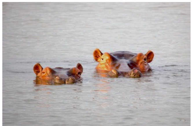
Neugierige Hippos in den Wetlands