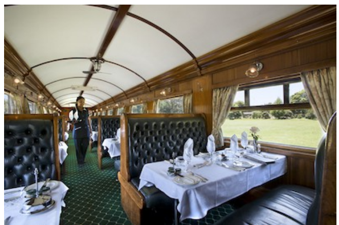
Der Speisewagen des Rovos