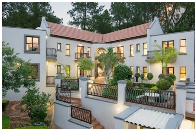
Das Mont D'Or Bohemian House