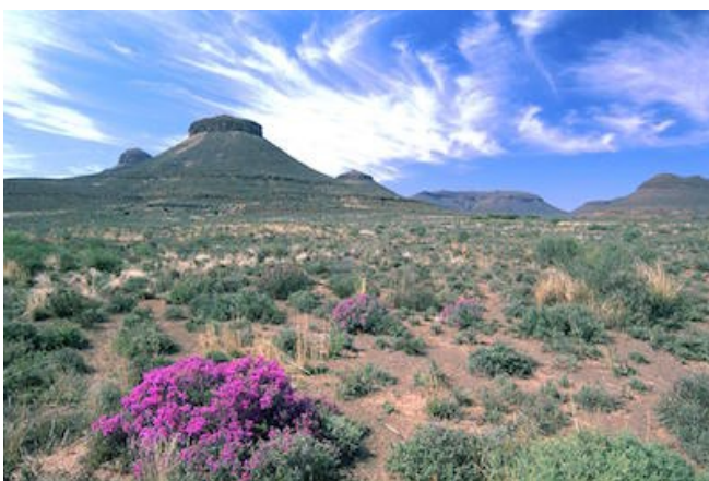
Die Karoo Halbwüste