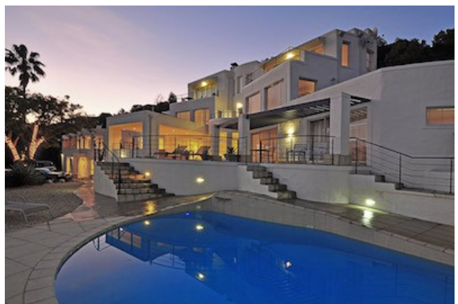
Die Villa Afrikana