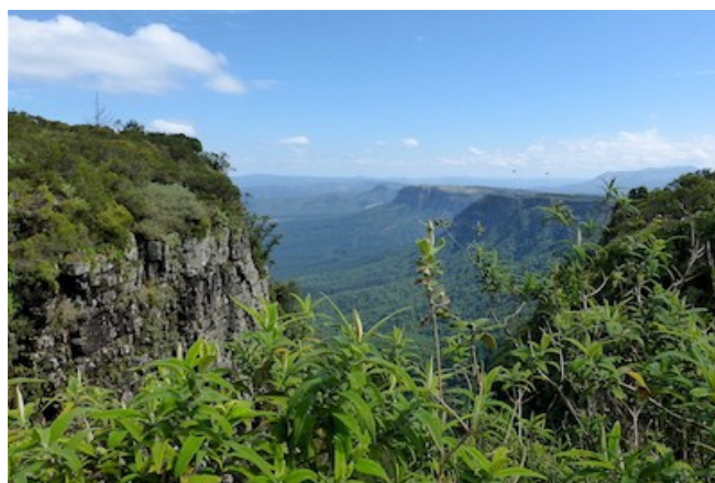
Traumhafte Aussicht am God's Window