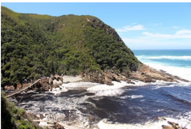
An der Flussmündung des Storms River

Sie übernachten in der luxuriösen Villa Afrikana mit tollen Ausblicken über die Lagune und die dichten Wälder des Hinterlands. Die sehr persönliche und stilvolle Atmosphäre bei Ihren herzlichen Gastgebern lädt zum Verweilen und Wohlfühlen ein. Die 6 Suiten verfügen über Bad/WC, TV, Tee-/Kaffeezubereiter, Ventilator, Safe und Föhn. Das Gästehaus bietet einen Pool, eine Lounge und einen Garten.