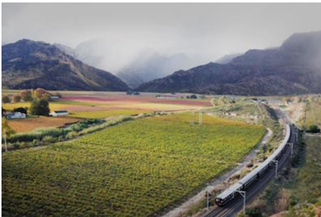
Der Rovos unterwegs durch die Weinregion

Die Pullman-Suiten sind ca. 7 qm groß und haben ein bequemes Klappbett, das tagsüber in eine Couch verwandelt wird. Die Deluxe-Suiten sind ca. 11 qm groß und haben ein Doppelbett und einen kleinen Loungebereich. Die Royal-Suiten sind etwa 16 qm groß und verfügen neben Doppelbett und Loungebereich zusätzlich über ein größeres Bad mit Badewanne. Alle Suiten können auch mit einer Twinbed-Konfiguration, also mit zwei Einzelbetten, gebucht werden (dann Hochbett in der Pullman-Suite).