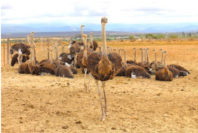
Zu Besuch auf einer Straußenfarm

Das charmante Pictures Guest House ist luxuriös und modern im Herzen der kleinen Karoo. Es besteht lediglich aus drei Zimmern, die allesamt individuell eingerichtet sind und über Klimaanlage, Ensuite Badezimmer, Tee-Kaffeestation, TV und einen eigenen Balkon verfügen. Das Gästehaus bietet einen Pool, eine Terrasse, eine Lounge und einen Fitnessraum. Kulinarische Höhepunkte bilden das ausgiebige Frühstück mit selbstgebackenem Brot sowie ein köstliches Drei-Gänge-Abendmenü am Table d'Hôtel, das auf Wunsch vorgebucht werden kann.