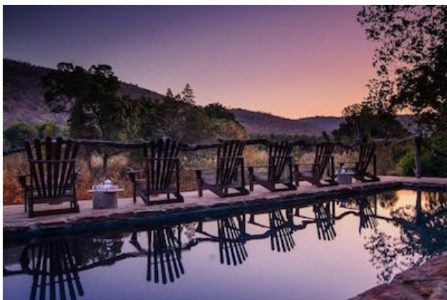
Das Summerfields Rose Retreat

Das luxuriöse Summerfields Rose Retreat & Spa liegt zwischen Sabie und Hazyview ganz in der Nähe des Krüger Nationalparks und den Attraktionen der Panorama Route. Die 12 Zeltsuiten bieten Bad/WC, Klimaanlage, Tee/Kaffeemaschine, Minibar, und Safe. Das Gästehaus bietet eine Bar, ein Restaurant, einen Spa-Bereich (gegen Gebühr), einen Garten mit Pool und einen traumhaften Ausblick auf das Lowveld.