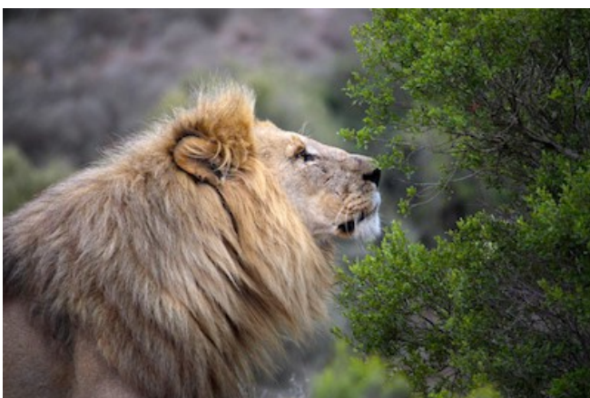
Die Big 5 hautnah