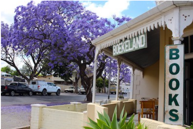
Jakaranda-Blüte in Robertson

Das Weingut Fraai Uitzicht 1798 ist in jeder Hinsicht bemerkenswert: Das Restaurant gehört zweifelsohne zu den besten der weiteren Umgebung, das tolle vier Sterne Gästehaus liegt wunderschön in den Weinbergen und seit 2006 wird auch endlich wieder Wein gekeltert. Die 10 Zimmer verfügen über Bad/WC, Klimaanlage, Tee-/Kaffeezubereiter Veranda und teilweise eine Außendusche. Das Gästehaus bietet einen Pool, eine schöne Gartenanlage, ein Restaurant und einen Weinkeller.