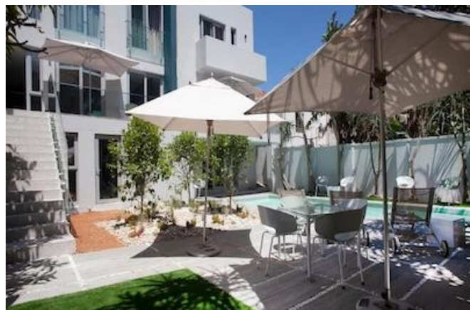
Das Zest Boutique Hotel