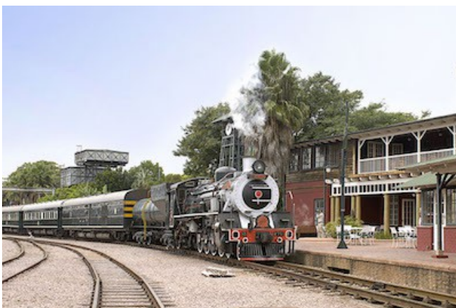
Ankunft in Pretoria

Sie wohnen im luxuriösen und zentral gelegenen Bohemian House, einem schönen Anwesen in einem gemütlichen Garten. Die zehn Zimmer haben alle ein eigenes Bad/WC. Über eine separate Tür gelangen Sie auf Ihren privaten Balkon bzw. Ihre private Veranda. Ferner verfügen alle Zimmer über extra lange Betten. Die Unterkunft bietet einen Pool, einen Garten sowie ein Restaurant.