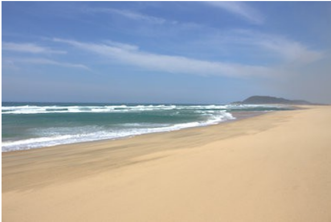
Traumstrand in St. Lucia

Das moderne Design des Serene Estate überzeugt durch die minimalistische Architektur. Die Herausforderung bestand darin, eine optimale Synthese zwischen Architektur und Landschaft zu erreichen. Für das afrikanische Ambiente wurden hier helle Farben und Lichteffekte verwendet. Die 5 Zimmer verfügen über Bad/WC, Klimaanlage, Ventilator, Minibar, TV, Safe, Föhn, WLAN und Tee-/Kaffe zubereiter. Das Gästehaus bietet einen Pool und einen Garten.