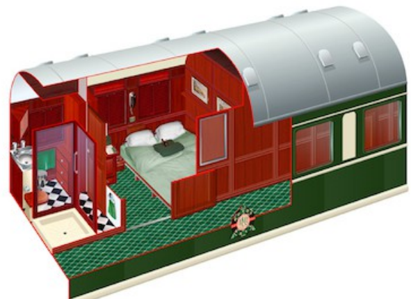
Die Pullman suite