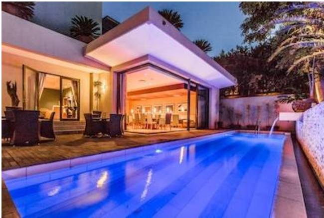
Das Mantis No. 5 Boutique Hotel

Sie übernachten im luxuriösen Mantis No 5, einem erstklassig restaurierten Art-Deko Hotel im Stadtteil Summerstrand. Der Strand ist nur etwa 150 Meter entfernt und auch zahlreiche Geschäfte und Restaurants finden Sie in unmittelbarer Nähe. Das Boutique Hotel verfügt über ein Fine Dining Restaurant, ein privates Kino, eine Lounge, einen Pool, ein Fitnesscenter und einen Spa-Bereich. Die 9 Suiten sind alle ausgestattet mit Bad/WC, Balkon/Terrasse, Sitzbereich, Minibar, Nespresso Maschine, TV, Klimaanlage, und Safe.