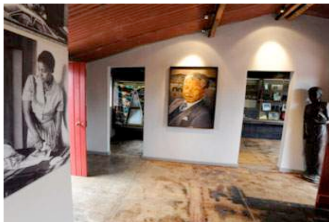
Nelson Mandela House