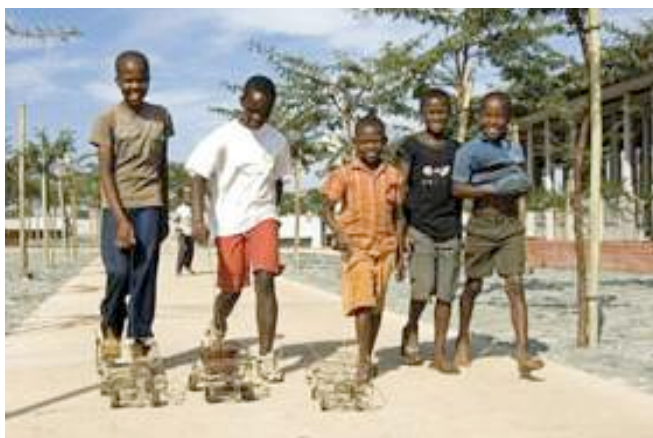
Kinder in Soweto