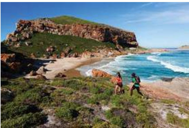
Wandern im Robberg Nature Reserve