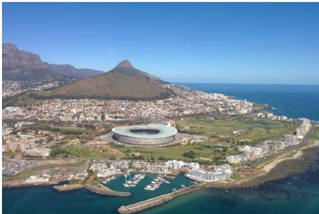
Green Point Stadion mit Signal Hill und Lion's Head