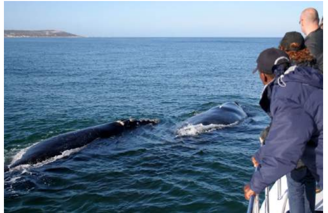
Auf Tuchföhlung mit den „sanften Riesen“