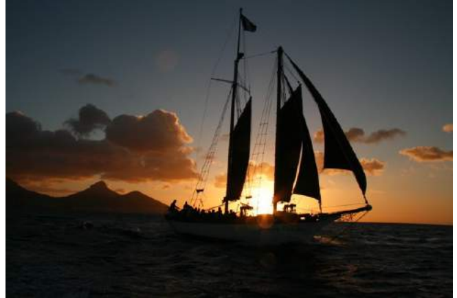
Segeltörn in den Sonnenuntergang