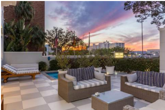
Außenbereich der Head South Lodge

Eine Vorübernachtung im Luxury Room der Head South Lodge inkl. Frühstück kostet EUR 79,- pro Person im Doppelzimmer (im Einzelzimmer EUR 149,- pro Person).