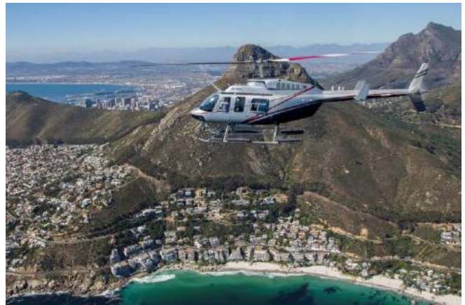
Helikopter über Clifton