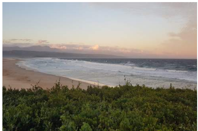
Blick auf das Meer in Plettenberg Bay