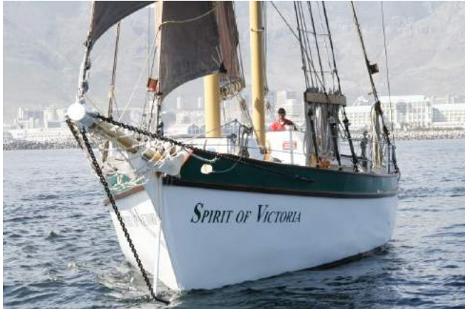
Die „Spirit of Victoria“ vor der Waterfront

Beginn: zwischen 17:00 und 19:00 Uhr (abhängig vom Zeitpunkt des Sonnenuntergangs)