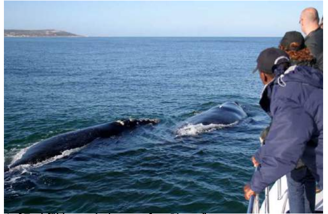
Auf Tuchföhlung mit den „sanften Riesen“