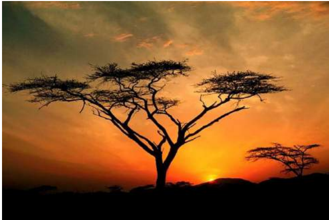
Sonnenuntergang im Busch