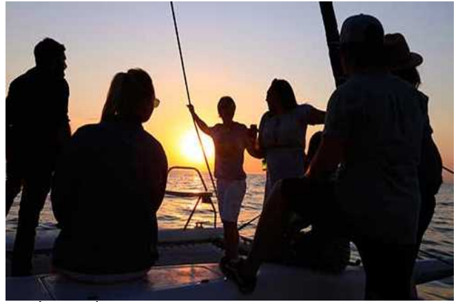
Segeltörn in den Sonnenuntergang