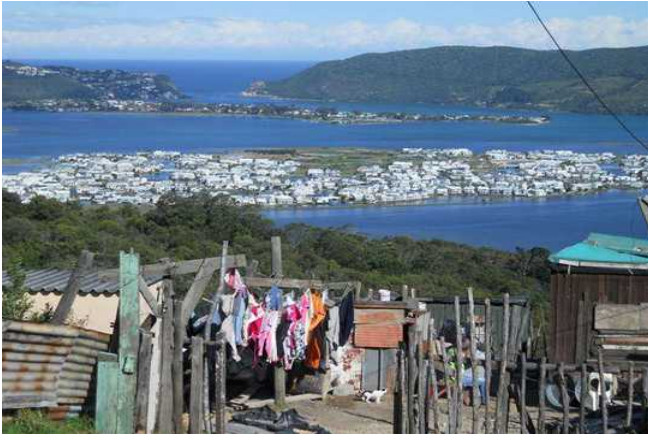
Blick vom Township auf die Lagune