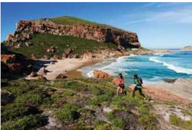
Wandern im Robberg Nature Reserve