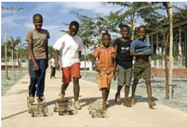
Kinder in Soweto