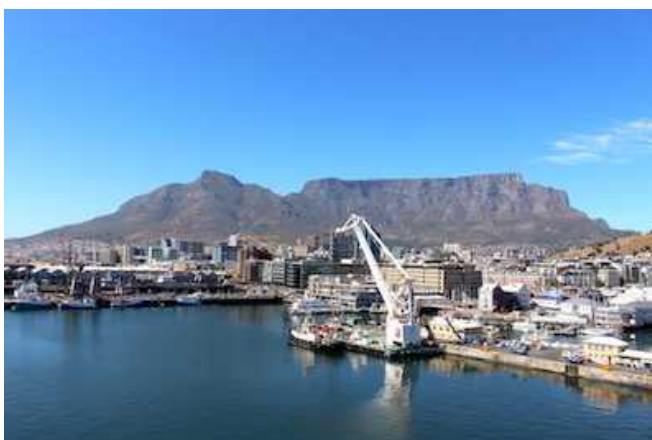
Waterfront mit Tafelberg