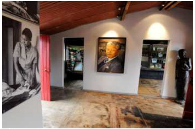
Nelson Mandela House