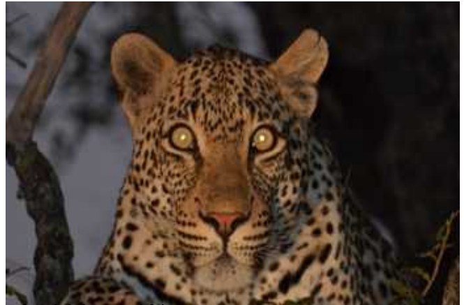
Auf nächtlicher Pirschfahrt