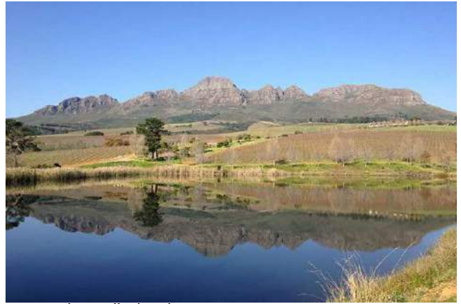
Weingut bei Stellenbosch