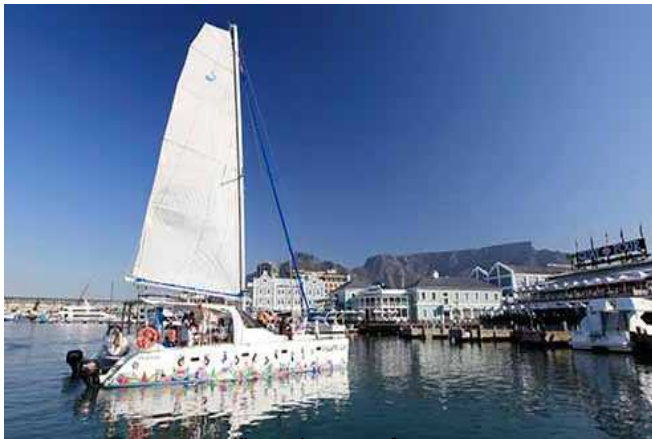
Katamaran „Escape Cat“ vor der Waterfront

Beginn: zwischen 17:00 und 19:00 Uhr (abhängig vom Zeitpunkt des Sonnenuntergangs)